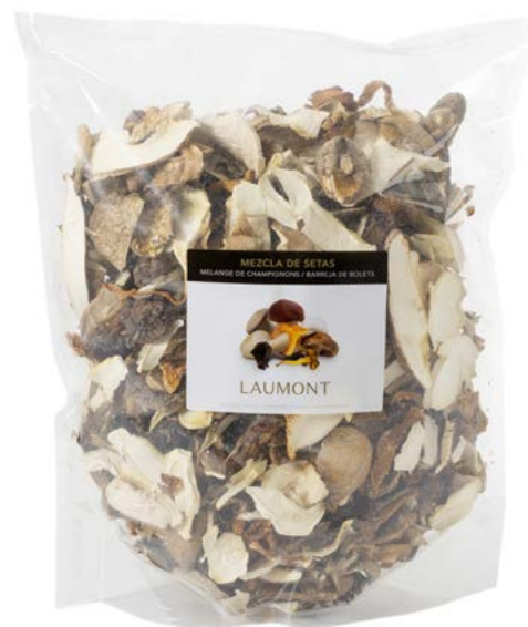
500 g bag Poche de 500 g Ref.: 20511