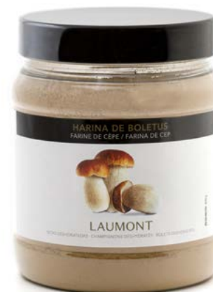
400 g PET pot Pot PET 400 g Ref.: 20094