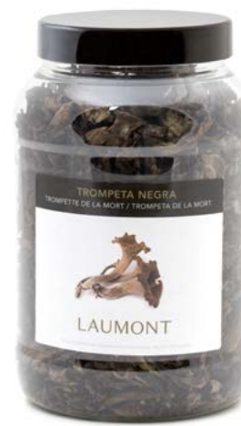
200 g PET pot Pot PET 200 g Ref.: 21712

Ingrédients: Craterellus cornucopioides sauvage.