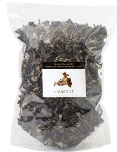
500 g bag Poche de 500 g Ref.: 21711