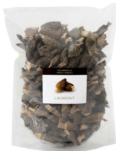
500 g bag / Poche de 500 g Size / Taille : -1 cm (Ref. 23210) / 1-2 cm (Ref. 23220) / 2-3 cm (Ref. 23230) / 3-4 cm (Ref. 23240) / +4 cm (Ref. 23250)