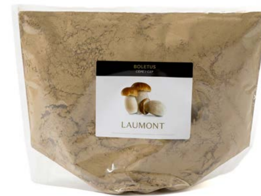
1 kg bag Poche de 1 kg Ref.: 20093