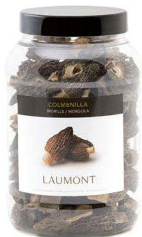
150 g PET pot Pot PET 150 g Ref.: 23232

Ingrédients: Morchella deliciosa sauvage.