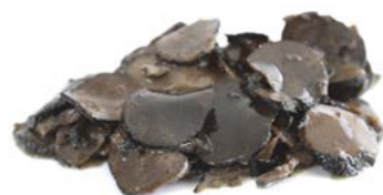
200 g can / 6 unit box Conserve 200 g / Cagette de 6 u. Ref.: 50080