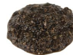
200 g can / 6 unit box Conserve 200 g / Cagette de 6 u. Ref.: 50049