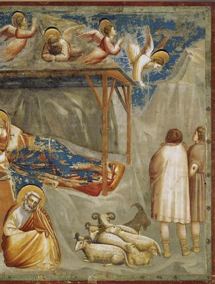
Giotto di Bondone, Geburt Jesu , 1303-1305. Fresko, 200 x 185 cm. Padua: Scrovegni-Kapelle.