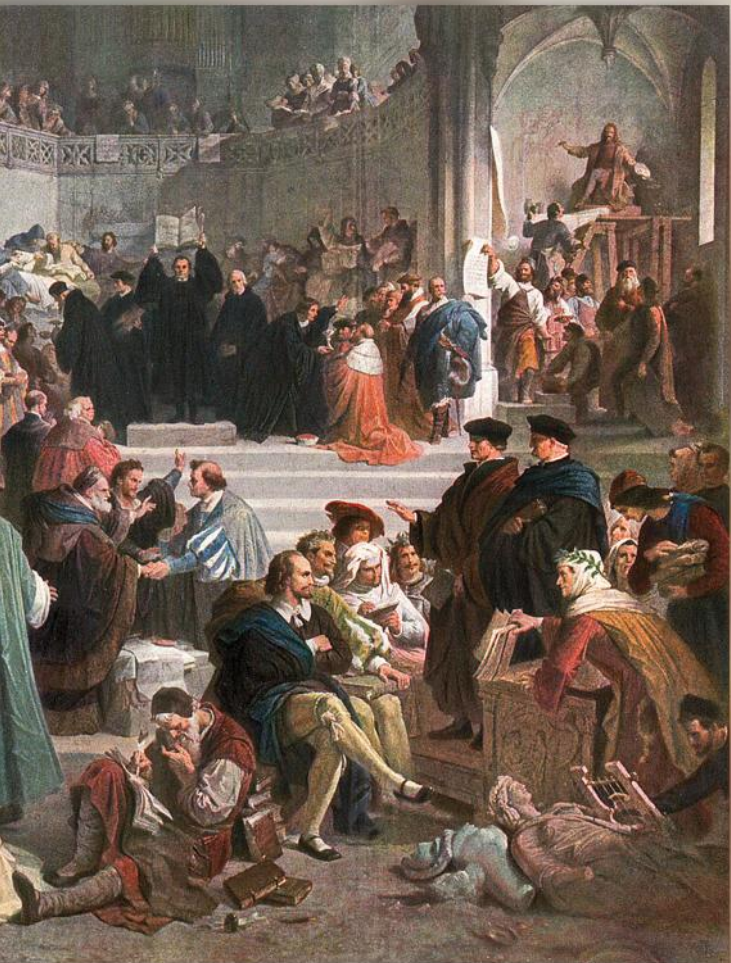
Wilhelm von Kaulbach, Das Zeitalter der Reformation, 1854/55; 900 x 800 cm; Wandgemälde im Neuen Museum zu Berlin (kriegszerstört)