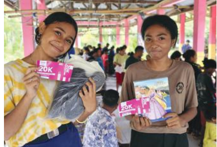
Anak-anak memilih kebutuhan sekolah (Thank You Project, Lembata).

Tidak semua anak memiliki akses ke buku dan guru yang memadai, terutama di wilayah terpencil. Sekolah Enuma hadir sebagai jawaban. Dalam kolaborasi dengan Head Foundation, program ini memperkenalkan metode belajar yang inovatif untuk meningkatkan literasi anak-anak. Dengan menggunakan teknologi dan permainan edukatif, anak-anak diajak belajar membaca dan menulis dengan cara yang seru dan penuh semangat.