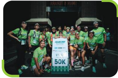
Penjelajah kategori 50 km di garis start.

Sebanyak 74 pelari mengikuti kegiatan ultra marathon pada 25-26 Oktober 2024, menempuh rute sejauh 20 jam dari Sembalun di kaki Gunung Rinjani hingga Pantai Kuta Mandalika dengan kategori jarak 100 km, 50 km, dan 12 km. Selain berlari, mereka juga menggalang dana sejak 17 Agustus hingga 10 November 2024, dengan berbagai inisiatif kreatif seperti fun run , yoga amal, merchandise lari, dan kegiatan lainnya.