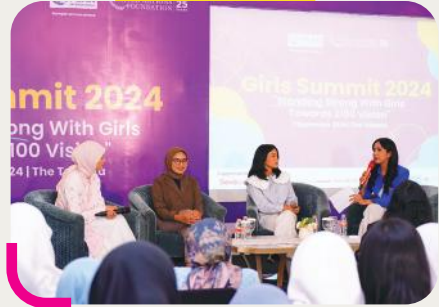
Girls Summit 2024 hadir dengan tema 'Standing Strong with Girls Towards 2100 Vision', mengajak perempuan muda untuk berani menghadapi perubahan dan berperan aktif dalam membentuk masa depan.