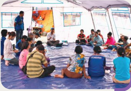
Pelatihan psikososial untuk membantu pemulihan psikologis masyarakat terdampak musibah meletusnya Gunung Lewotobi Laki-Laki