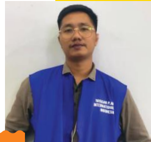
Krada Franciscus F2F Fundraiser Plan Indonesia

Semoga Plan Indonesia selalu menjadi garda terdepan dalam memperjuangkan hak anak-anak!