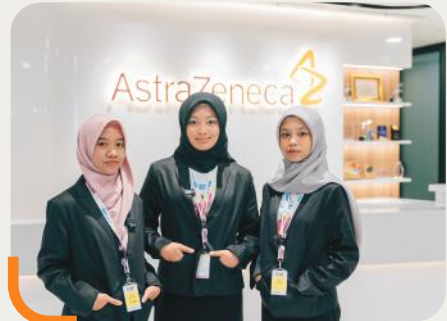
Tiga pendidik sebaya dari Young Health Programme memimpin AstraZeneca Indonesia selama satu hari melalui kampanye Girls Takeover 2024, bertema #GirlsBelongHere