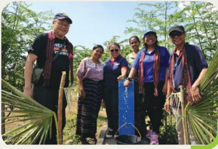
Peresmian sarana air bersih di Desa Lamagute, Kabupaten Lembata, NTT