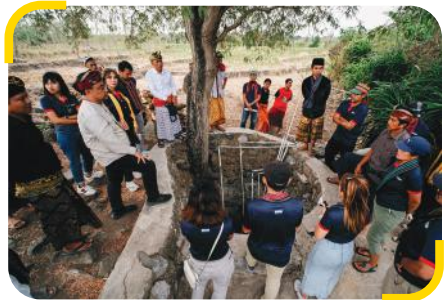
Kunjungan Penjelajah ke Desa Wakan.

Kali ini, Desa Wakan dan Desa Bilelendo di NTB menjadi desa penerima manfaat. Keterbatasan air bersih adalah masalah utama di desa tersebut. Selain untuk kebutuhan konsumsi, warga juga kesulitan memenuhi kebutuhan mandi, cuci, dan kakus (MCK). Curah hujan rendah dan medan berbukit menyulitkan distribusi air bersih, sehingga warga terpaksa membeli air dengan biaya yang membebani rumah tangga.