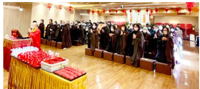
▲東京佛光山寺元旦起舉行三天禮千佛法會，三天近三百位信眾回寺修持，住持覺用法師開示：要創造福報的旅程、以憂患長養身心、將困難化為增強我們的力量、以信仰力生長快樂、僧信互相成就淨土。元月三日午齋時常住送大師的包子予大眾，拿到包子大家都十分歡喜，紛紛表示謝謝大師的慈悲。