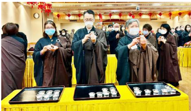
▲東京佛光山寺1月28日舉行上燈法會，信眾60人回寺參加。點亮一盞歡喜的燈、智慧信仰的燈、和平之燈，以佛光破除我們內心貪、瞋、癡、煩惱無明的黑暗。