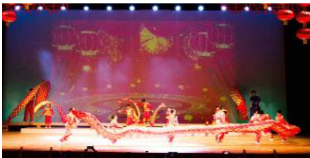
▲ 2024 年東京全球華僑華人少兒春晚 2 月 8 日於板橋區立文化會館舉行，因別院的三好兒童參與舞龍之演出，覺用、妙崇、如恭法師、東京協會陳宥希會長等 30 位佛光人前往觀賞，為小朋友加油。