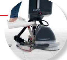
Bediening zuigmond met de voet

Lang verwacht en boven verwachting. De 244NX is de nieuwste aanwinst in het compacte machine assortiment van Numatic.