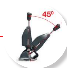
Vrij beweegbare hendel met unieke parkeerstand