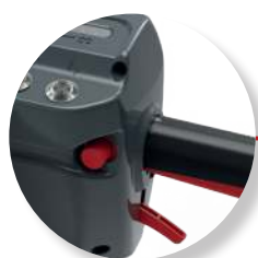
Essentiële elementen 'touch points' in rood