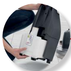
Gemakkelijk vullen en legen van tanks