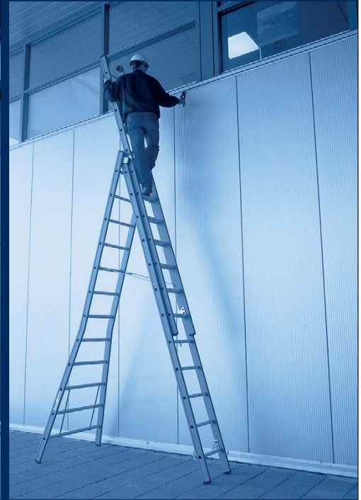
ladders & trappen