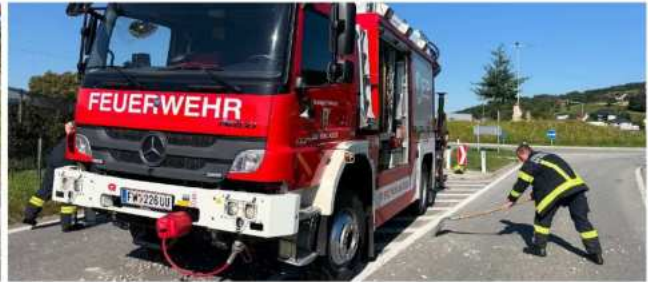
LKW verlor Schotter auf der B131