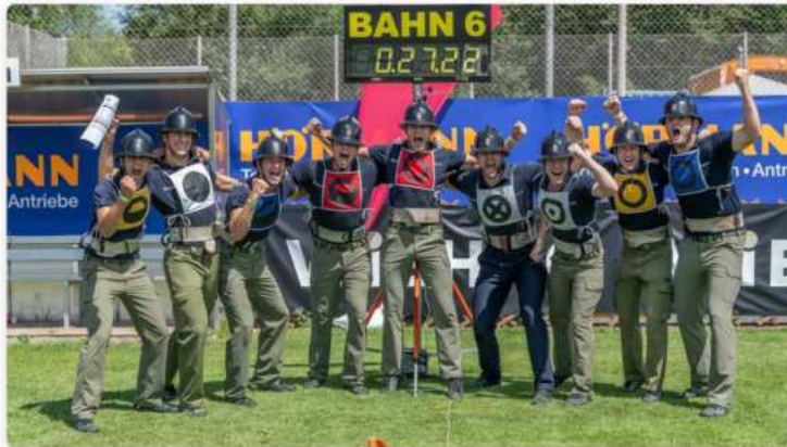
Tagesbestzeit und zwei Landessiege für die Aktivgruppe der Freiwilligen Feuerwehr Bad Mühlacken

Von Bernhard Leitner, 07. Juli 2025, 16:17 Uhr