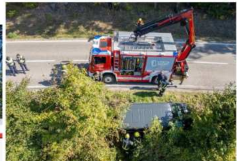
Verkehrsunfall auf der St.Martiner Bundesstraße