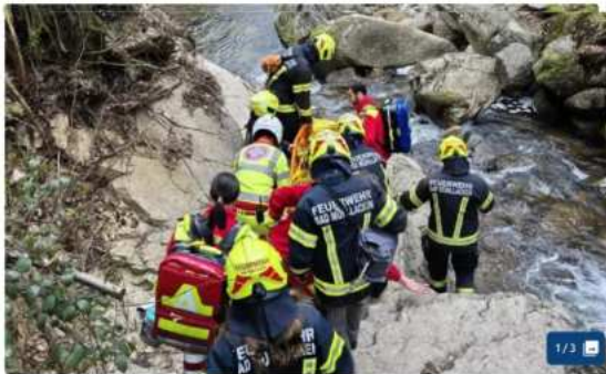
Die Einsatzkräfte trugen die Person aus dem Tal.

FELDKIRCHEN AN DER DONAU. Die Feuerwehr Bad Mühlacken und der Arbeiter-Samariter-Bund Feldkirchen mussten am Mittwoch ins Pesenbachtal ausrücken.