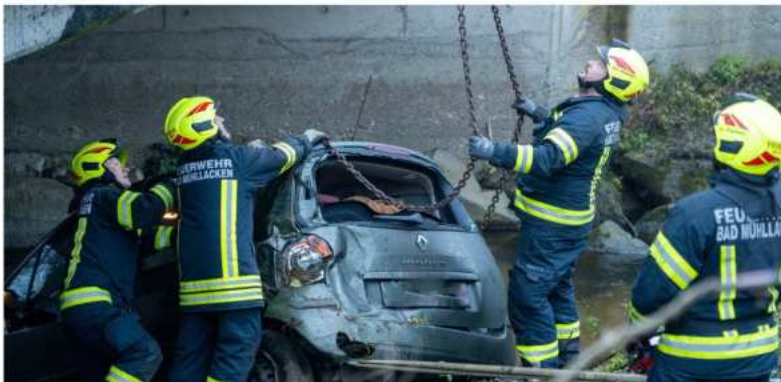
Verkehrsunfall auf der B131