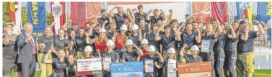
Riesen-Freude für die FF Bad Mühlacken über drei erste Plätze