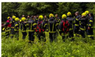
Übung aller Gruppen zum Thema Waldbrand