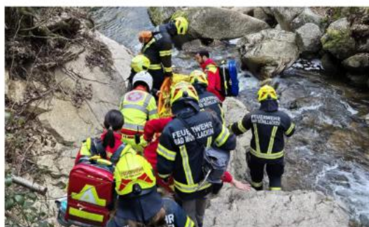
Personenrettung im Pesenbachtal