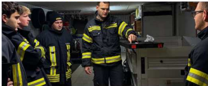
Vertiefende Übungen zum Thema "Gefährliche Stoffe"