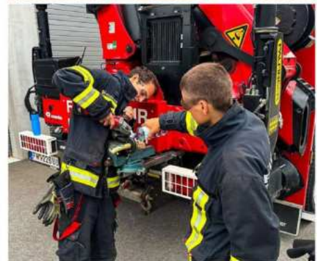
Feuerwehübergreifende Stützpunktfahrzeugübung mit dem Gefährliche Stoffe Fahrzeug der FF Kefermarkt