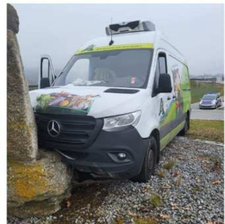
Verkehrsunfall beim Kreisverkehr