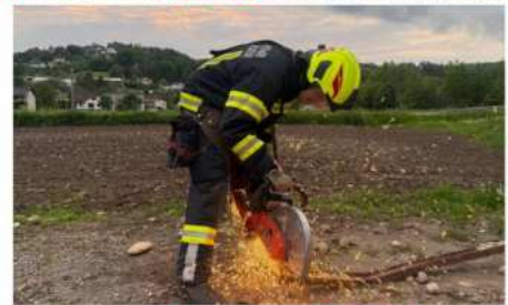
Gruppe U40 bei den Übungen zum Technischen Einsatz