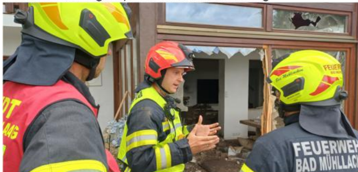
Druckentlastungsexplosion am Sechterberg