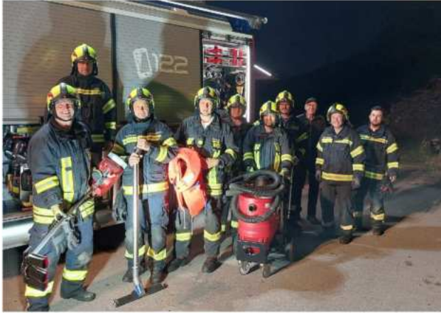
Gruppe Ü40 übt zum Thema "Hochwasser"