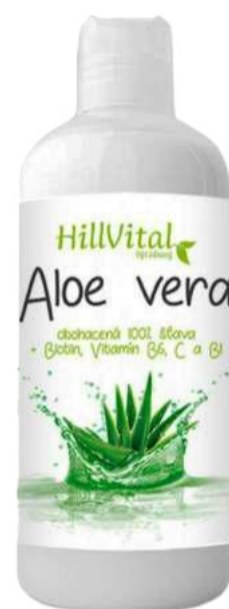
Aloe Vera Obohacená 100% šťáva | 1000 ml