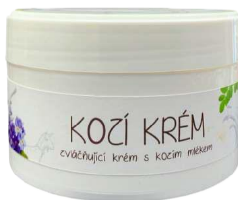
Kozí krém na obličej a tělo Pro suchou a citlivou pokožku | 250 ml