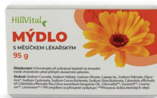
Mýdlo s měsíčkem lékařským Hojení ran a záněty | 95 g