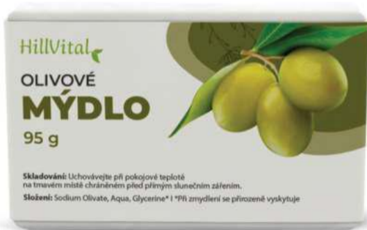
Olivové mýdlo Přírozené pH pokožky | 95 g