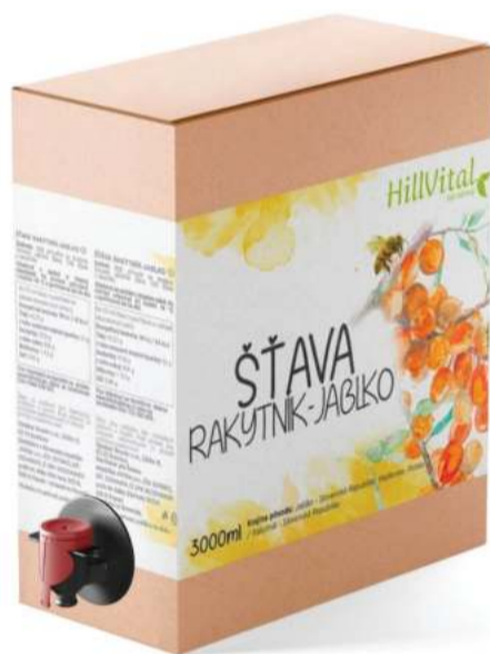
Přírodní šťáva Rakytník a jablko 3l Imunitní systém | 3 000 ml

Kromě toho posilují imunitní systém a zároveň jsou skvělou volbou pro doplnění tekutin během celého roku.