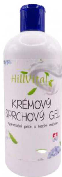
Sprchový gel s kozím mlékem Zvlhčuje pokožku | 400 ml