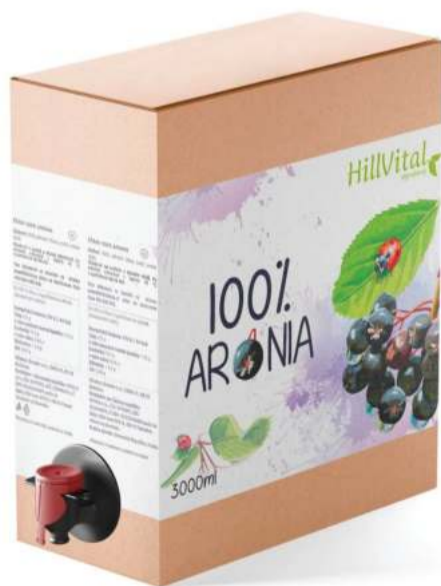
100% přírodní šťáva Aronie Imunita a krevní oběh | 3 000 ml