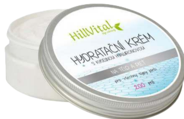
Hydratační krém Hydratace pokožky | 200 ml