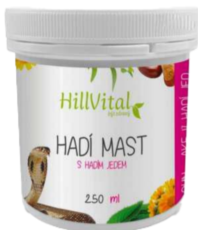
Hadí mast Úleva od bolesti | 250 ml