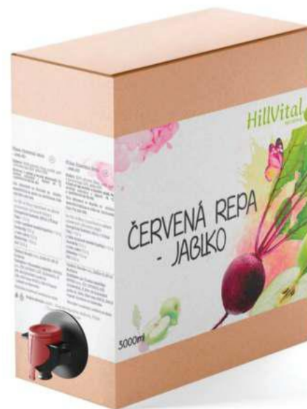
Přírodní šťáva Řepa a jablko 3l Krevní tlak, cholesterol | 3 000 ml