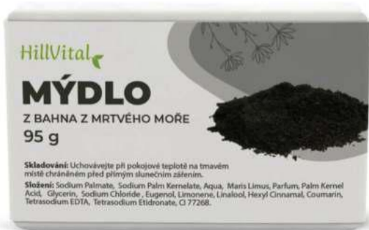
Mýdlo z bahna z Mrtvého moře Ekzém, lupénka a seborea | 95 g