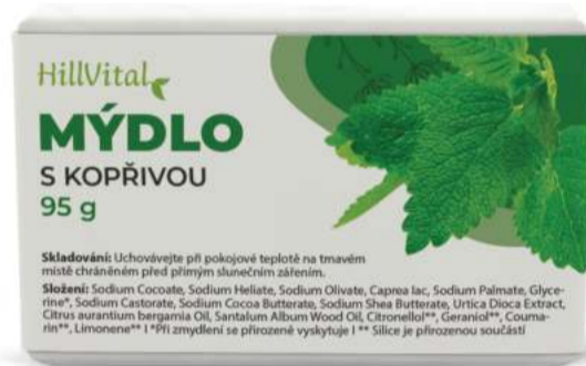
Mýdlo s kopřivou Mastná pleť a akné | 95 g