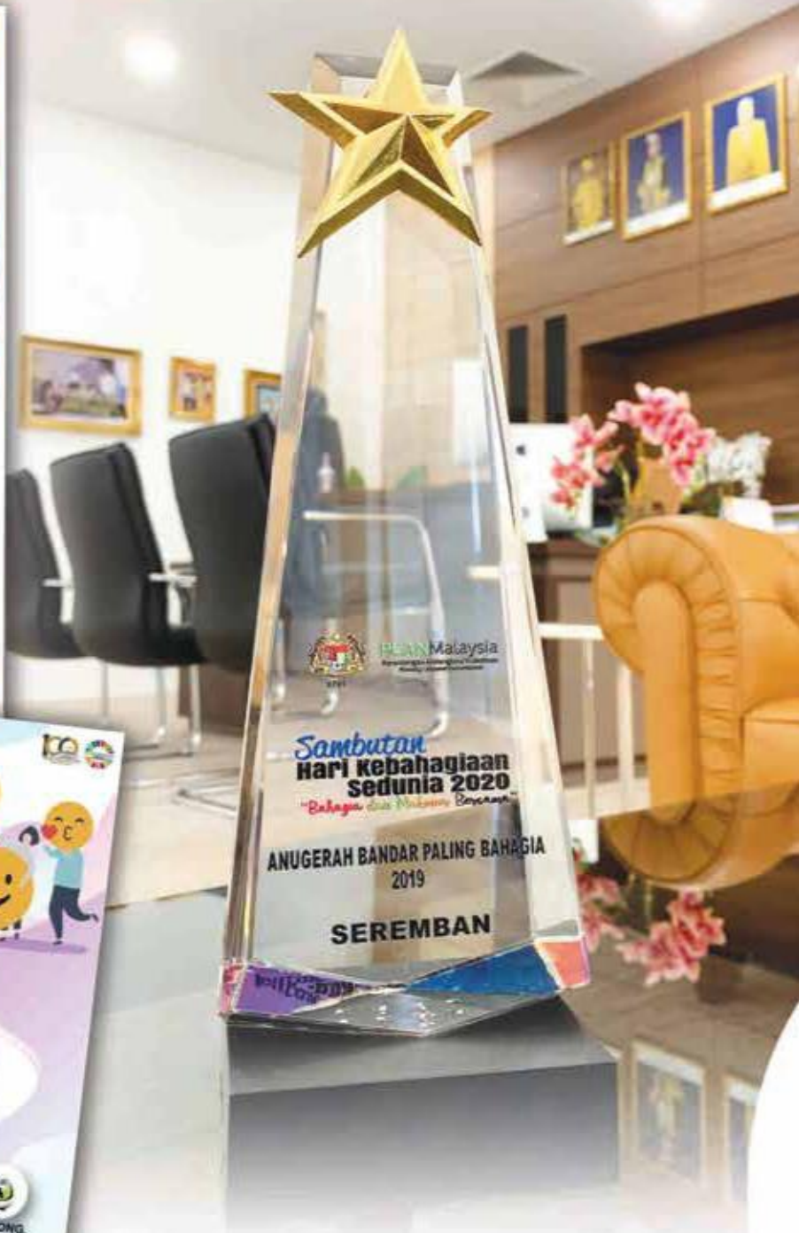
Warga kerja Majlis Bandaraya Seremban merakamkan penghargaan dan terima kasih di atas penganugerahan Bandar Paling Bahagia Tahun 2019 sempena Hari Kebahagiaan Sedunia 2020.