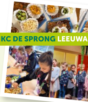
IKC DE SPRONG LEEUWA

Buiten lezen Lezen is al fijn, helemaal als het buiten kan!