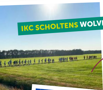
IKC SCHOLTENS WOLVEGA

Avond 4-daagse Wandelen onder een stralende zon.