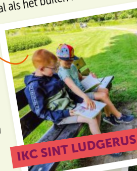
IKC SINT LUDGERUS

Buiten lezen Lezen is al fijn, helemaal als het buiten kan!