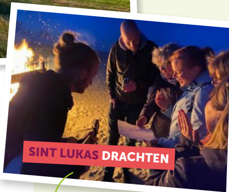
SINT LUKAS DRACHTEN

Samen zingen Van samen zingen ga je stralen!