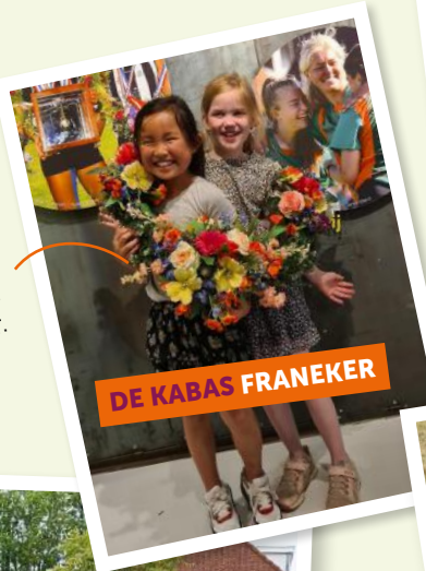
DE KABAS FRANEKER

Stralend gehuldigd Groep 4 voelt hoe het is om als winnaars gehuldigd te worden bij het Keatsmuseum in Franeker.