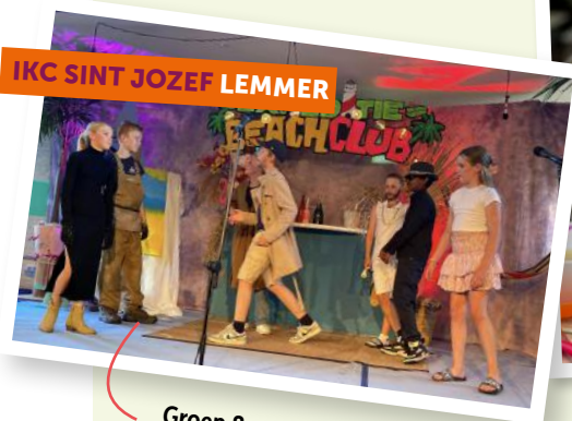
IKC SINT JOZEF LEMMER

Groep 8-musical De toppers van groep 8b in actie met flink wat acteer- en zangtalent en super veel enthousiasme.