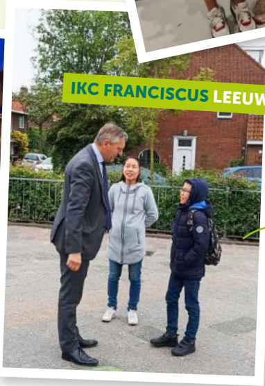
IKC FRANCISCUS LEEUWARDEN