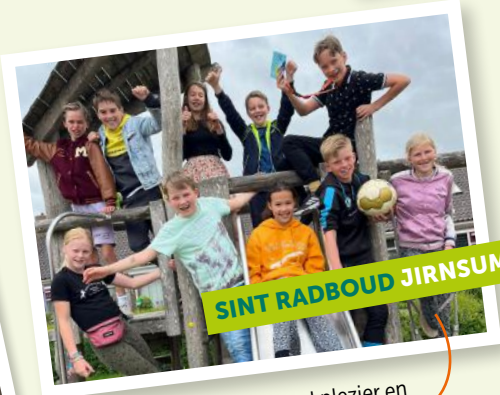
SINT RABBOUD JIRNSUM

Stralende groep 8 Heel veel plezier en succes op de middelbare school!