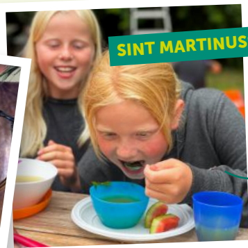
SINT MARTINUSSCHOOL MAKKUM

Oogstfeest Kinderen maken en genieten van een feestmaal van zelfgekweekte groenten en fruit in de schooltuin. Ook hun ouders konden meegenieten.