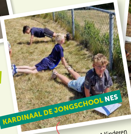
KARDINAAL DE JONGSCHOOL NES

Zonnegroet Kinderen doen de zonnegroet tijdens kinderyoga 'Hemel en aarde'.