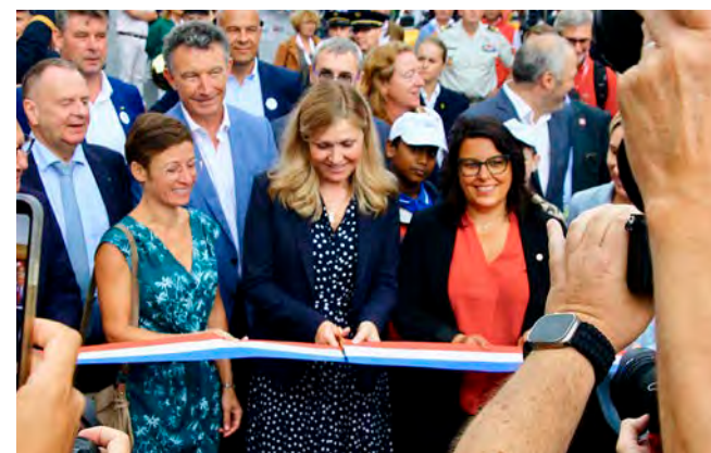
La présidente de l'Assemblée nationale, Yaël Braun-Pivet, avait inauguré la 78e Foire de Châlons l'an passé.

Quant aux ministres, dont les visites sont parfois validées, voire annulées la veille pour le lendemain, « tous ont été conviés, en corrélation avec les thématiques développées sur la Foire. » En premier lieu, la ministre de l'Agriculture, Annie Genevard, d'ailleurs de passage dans la Marne ce lundi. La locale de l'étape Catherine Vautrin, ministre du Travail, de la Santé, des Solidarités et des Familles, sera au rendez-vous. La personnalité qui inaugurera la Foire n'est pas actée. « Le Premier ministre ? Le président de la République ? Je ne sais pas. Une chose est sûre, sa venue créera un véritable impact médiatique. » Comme chaque année.