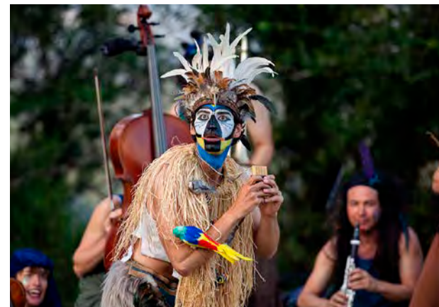
Un spectacle original à vivre sous forme de balade en cinq étapes dans les rues et les bois de Germaine

✓ La Flûte enchantée, lundi 14 juillet à 20 h 30 à Germaine (départ au 3, rue du Pré Michaux). Tarifs : 15 € (adulte et +16 ans), 8 € (10-16 ans), gratuit pour les moins de 10 ans. Réservations sur le-cerf-a-3-pattes.fr.