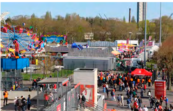
La fête foraine aura lieu du 12 au 20 juillet.

La traditionnelle fête foraine d'été fera son retour, le samedi 12 juillet, sur la chaussée Bocquaine, mitoyenne du stade Auguste-Delaune. Jusqu'au dimanche 20 juillet, une quarantaine de stands seront à retrouver, parmi lesquels des manèges à sensations fortes, des attractions pour les enfants, des jeux et des stands gourmands. Le Terminator, notamment, fera son grand retour après deux ans d'absence pour une rénovation des moteurs. Les horaires seront les suivants : samedi 12 juillet, de 15 h à 1 h ; dimanche 13 juillet, de 15 h à 2 h ; lundi 14, mardi 15, mercredi 16, jeudi 17 juillet : de 15 h à 23 h ; vendredi 18 juillet, de 15 h à 1 h ; samedi 19 juillet : de 15 h à 1 h ; dimanche 20 juillet : de 15 h à 23 h. À noter que ces horaires sont non contractuels et les organisateurs se réservent le droit de fermer à partir de 20 h, selon l'affluence.