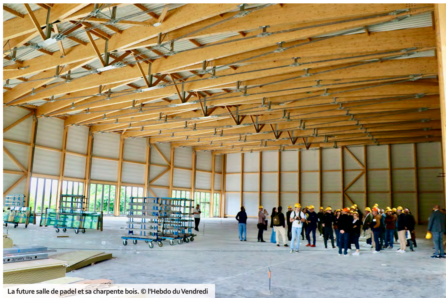
La future salle de padel et sa charpente bois.

Côté sports, les équipements seront ouverts à la clientèle le midi, en fin d'après-midi et le week-end. En dehors de ces créneaux, ils accueilleront les jeunes des écoles, des collèges et des centres de loisirs. La salle de padel, avec sa vaste charpente en bois, a dû être agrandie par rapport aux plans initiaux, afin de répondre aux normes internationales, ce qui permettra à VO2 d'accueillir des compétitions de haut niveau.