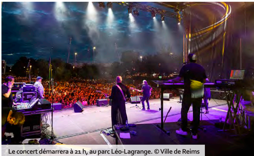
Le concert démarrera à 21 h, au parc Léo-Lagrange.

Puis, à partir de 21 h, le concert « Totalelement 90 » démarrera, par l'entremise des maîtres de cérémonie Charly et Lulu. Les deux animateurs emblématiques des années 1990 se sont fait connaître en présentant l'émission musicale Hit Machine sur M6, pendant 13 ans, tout en poursuivant une carrière musicale au sein du duo parodique Top Boy. Tous ceux qui ont vécu à cette époque se souviennent sans doute de l'inoubliable morceau « Le Feu ça brûle »... Depuis le début des années 2010, ils animent régulièrement des tournées autour des chanteurs populaires de leur époque et ils seront nombreux à Reims, à