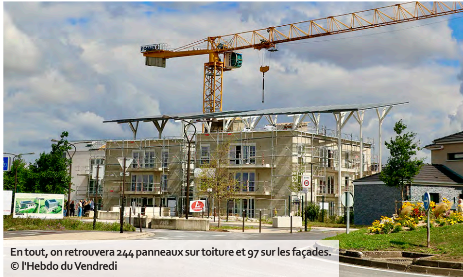
En tout, on retrouvera 244 panneaux sur toiture et 97 sur les façades.

Ce nouveau programme se nomme à dessein Noviliasun, un bâtiment de quinze logements, dont la construction a démarré en décembre 2023 et doit s'achever au début de l'année prochaine.