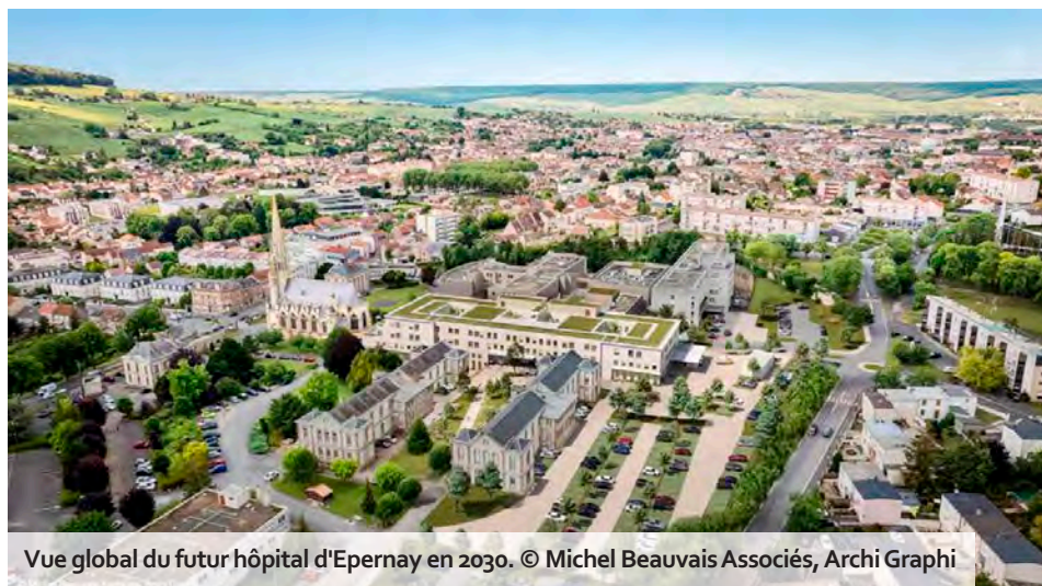
Vue globale du futur hôpital d'Épernay en 2030.