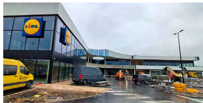
Open Park est presque prêt. Le supermarché Lidl sera la locomotive du parc.