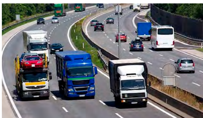
Les plus de 3,5 tonnes ne peuvent désormais plus dépasser sur l'A4 entre Taissy et Les Grandes Loges.

Une campagne d'information doit être lancée avec les partenaires de la sécurité routière et la Sanef, société concessionnaire des autoroutes de l'Est et du Nord, pour sensibiliser le plus grand nombre à cette nouvelle règle via des panneaux de communication et des messages radio sur la station Autoroute Info (fréquence 107.7). Les premiers contrôles assurés par les forces de l'ordre, plutôt axés sur la pédagogie, laisseront ensuite place aux verbalisations. Rendez-vous l'été prochain pour le bilan.