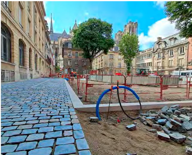
Les pavés sont en cours de pose.

Enfin, il faudra dire adieu aux 36 places de stationnement que comportait la place. Seuls les riverains (habitants, cabinets d'avocats et cabinet médical) pourront franchir une borne grâce à un badge, côté cathédrale, pour accéder aux quatre places de stationnement et quelques dépose-minute qui y seront tracés. Initialement annoncé à 1,5 M€, le budget de l'opération est finalement de 3,4 M€. L'inauguration de la nouvelle place du Chapitre est prévue pour la fin de l'année.