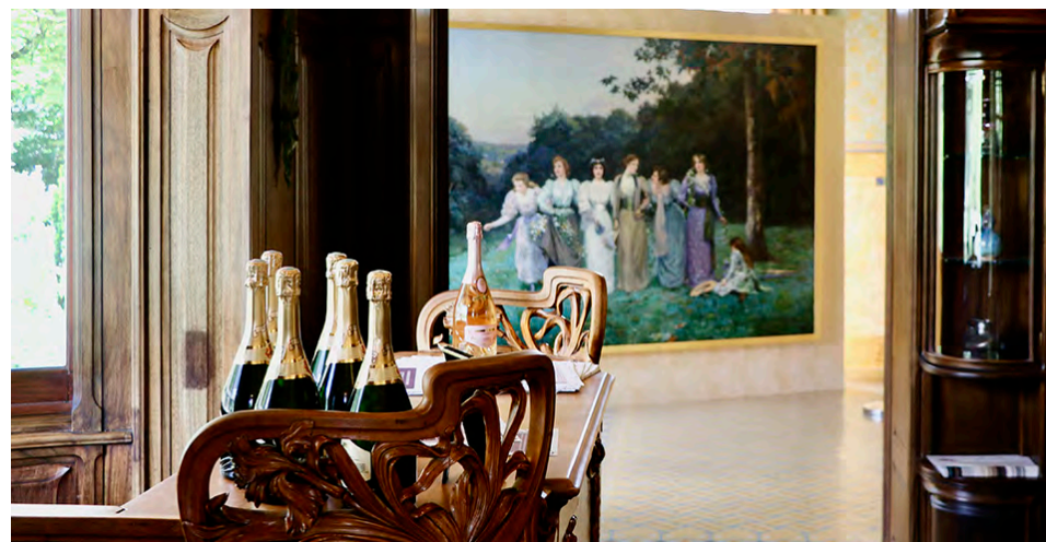
Symbolisme, naturalisme, Art nouveau, Art déco, art contemporain... L'exposition à la villa Douce mélange les courants avec audace et à-propos.

C'est un bâtiment iconique de Reims, mais parfois méconnu des Rémois. La villa Demoiselle est un bijou de l'architecture Art nouveau, construite au début du XX e siècle dans un quartier que l'on nomme aujourd'hui Pommery. Située face au célèbre domaine éponyme, cette riche bâtisse a été commanditée par Henry Vasnier, qui a pris la direction de la maison de champagne rémoise en 1890 suite au décès de Jeanne Alexandrine, dite la veuve Pommery. Mécène, collectionneur et grand amateur d'art, il a souhaité faire de cet hôtel particulier un lieu d'habitation et de réception à la hauteur de ses goûts. « Henry Vasnier a fait appel à l'architecte Louis Sorel, qui a amené tous ces artistes et artisans du Paris de l'époque, explique Sofie Vanhoe, coordinatrice des expositions au domaine Pommery. C'est la raison pour laquelle la villa Demoiselle est emblématique de l'Art nouveau à Reims, beaucoup moins présent que l'Art déco, que l'on retrou-