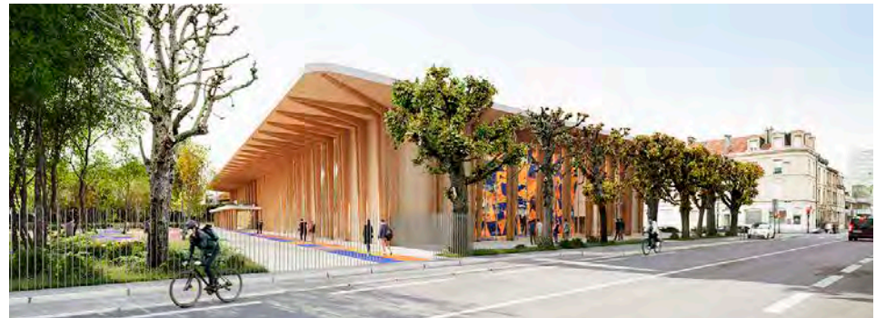
L'ouverture du complexe est prévue au dernier trimestre 2028. © Chabanne / Alexandre Besson

U n an après avoir annoncé la transformation du complexe sportif Courcelles, la ville de Reims a présenté plus en détail ce projet estimé à 13 M€, en dévoilant notamment des visuels. Ce site de 14 000 m², où la municipalité avait aménagé, en 2022, deux terrains de basket 3x3 en extérieur, doit devenir « un vrai lieu de convivialité pour les résidents du quartier Clairmarais, offrant des espaces de loisirs, de sport et de détente accessibles à tous », précise la ville.