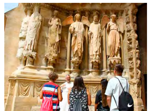
La fermeture de Notre-Dame de Paris a profité à sa voisine rémoise.