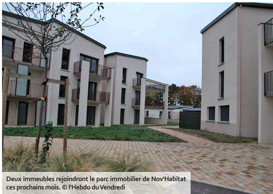
Deux immeubles rejoindront le parc immobilier de Nov'Habitat ces prochains mois.

Ces déconvenues ne sont pas les premières auxquelles se heurte Desimo. « Le contexte conjoncturel, notamment la hausse des coûts, compliquent sérieusement les choses. On a dû remplacer au pied levé un plaquiste, lui aussi en liquidation, ainsi qu'une entreprise qui a augmenté sa facture de plusieurs centaines de milliers d'euros sans nous prévenir... » Avec, à l'arrivée, un an de retard cumulé sur les livraisons de logements. S'il n'est pas en mesure d'acter un calendrier actualisé pour l'heure, le promoteur espère lancer une nouvelle phase de construction début 2025. « La priorité, c'est de terminer les immeubles déjà achetés par le bailleur Nov'Habitat. »