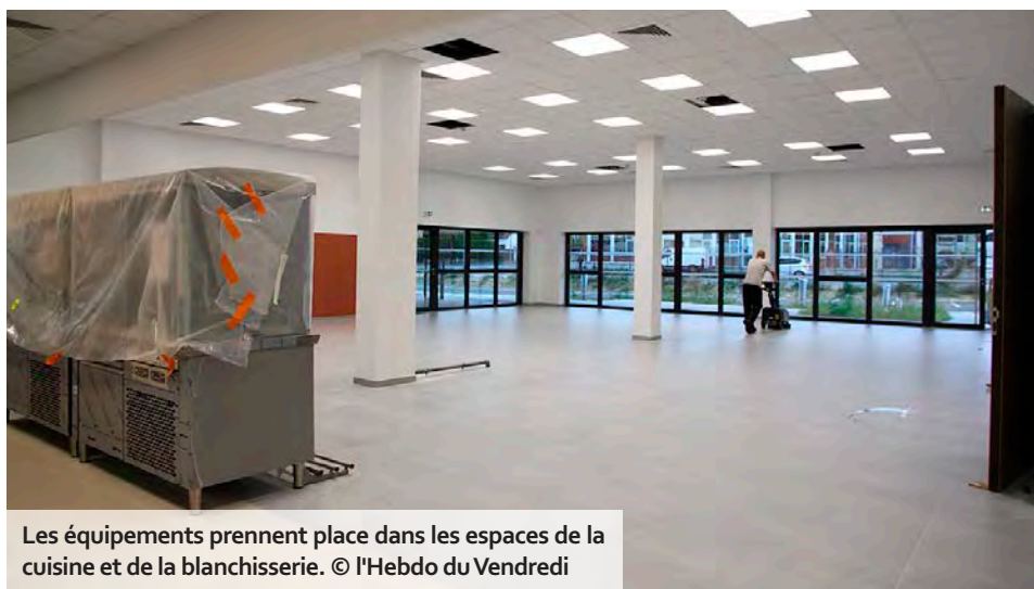
Les équipements prennent place dans les espaces de la cuisine et de la blanchisserie.

Le programme de logements inclusifs porté par l'ACPEI et le bailleur social Nov'Habitat est complètement sorti de terre, rue Forgeot. Pour rappel, ces appartements ont été conçus et fabriqués à partir d'anciens conteneurs maritimes par la société High Cube, implantée à Châlons. L'ensemble, qui comprend une vingtaine de logements adaptés aux personnes handicapées, mais aussi des espaces communs, a été pensé comme un mini-village ouvert sur l'extérieur. Il sera inauguré le 29 novembre par les instigateurs, les officiels et les habitants.