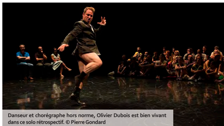
Danseur et chorégraphe hors norme, Olivier Dubois est bien vivant dans ce solo rétrospectif.

Une fois n'est pas coutume, le festival rémois pare Le Manège d'une programmation audacieuse et inédite, pensée pour mettre en valeur les corps, leurs imaginaires, leurs narrations. En effet, Louis Barreau, artiste en compagnonnage, propose, dès la soirée d'ouverture, ses trois concertos pour piano de Bartók. Il s'agit d'une création pour neuf danseuses et danseurs qui, appuyée sur les trois concertos pour piano et orchestre de Béla Bartók, devient un feu d'artifice chorégraphique. Les corps des interprètes deviennent lignes, dessins aériens, partition musicale et architecturale, pour une abstraction rythmique, comme une déclaration au vivre-ensemble. Et si Louis Barreau lance le festival, c'est tout un symbole, car il sera à suivre pendant l'intégralité de la saison, notamment avec son autre création, « 30 cœurs 4 saisons », le 21 juin, une adaptation