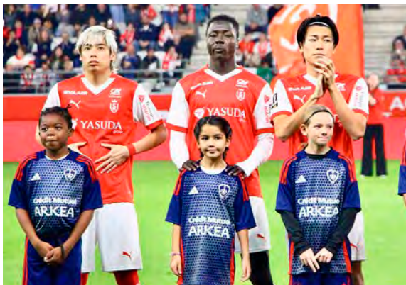
Face à Brest, les Rémois ont été plombés par leur entame.