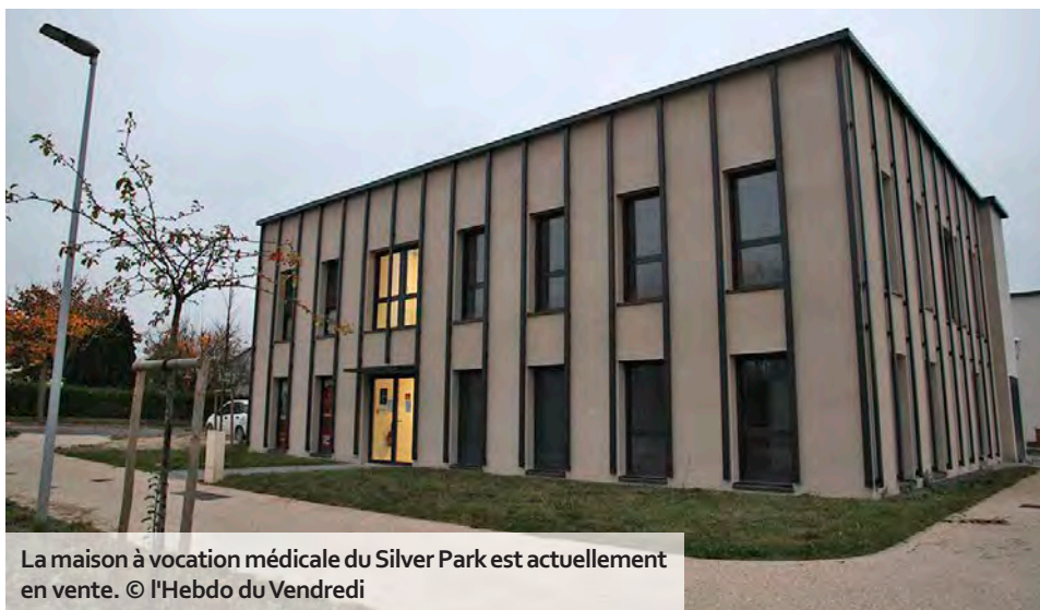
La maison à vocation médicale du Silver Park est actuellement en vente.

Sous la mandature d'Alain Biaux à l'époque, la municipalité fagniérote avait effectivement refusé de porter le projet de maison médicale. « C'était une demande de l'investisseur, mais nous n'avions clairement pas les moyens. En revanche, on a créé un groupe de travail avec la pharmacie de Fagnières et même contacté la faculté de médecine à Reims pour trouver de jeunes médecins potentiellement intéressés. Les travaux se sont éternisés, ils sont partis ailleurs. Il serait judicieux de les recontacter aujourd'hui. » Le premier édile ne s'explique pas le manque d'intérêt des médecins pour la nouvelle structure pluridisciplinaire. « Le cabinet monté il y a quelques années par des médecins et des kinésithérapeutes face à l'école, dans l'ancien bureau de poste, affiche complet. L'ARS (Agence régionale de santé, ndlr) prévoit différentes aides à l'installation. » Parallèlement, les élus municipaux ont voté, fin 2023, l'attribution d'une prime de 10 000 € pour inciter les médecins à rejoindre Fagnières.