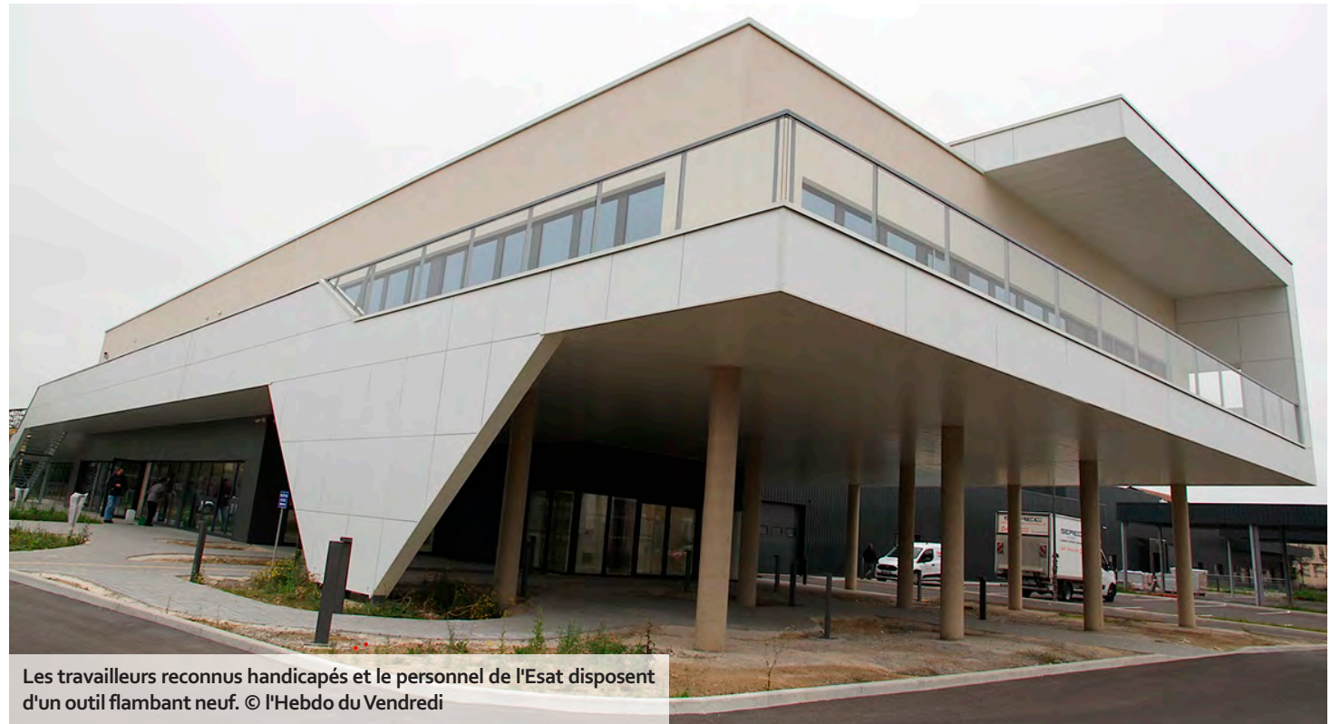
Les travailleurs reconnus handicapés et le personnel de l'Esat disposent d'un outil flambant neuf.

Deux ans de chantier ont été nécessaires à la construction du site sur la friche jadis occupée par France Champagne Équipement, au croisement des avenues Léopold-Bertot et Ampère. « On s'implante au cœur de l'activité économique et de la zone industrielle historique de Châlons. C'est assez proche du centre-ville, avec des pistes cyclables et des arrêts de bus. C'est idéal. » Surtout, l'écrin a été pensé pour améliorer les conditions de travail et faciliter le suivi, mais aussi la montée en compétences des personnes déficientes intellectuelles. Tout en optimisant le fonctionnement des différents sites de l'Esat, jusqu'ici dispersés sur le territoire châlonnais, désormais réunis en un même lieu et à travers quatre pôles d'activités professionnelles. Le pôle restauration comprend la cuisine centrale, la légumerie, et se dote d'un nouveau self de 170 places assises, tandis que le pôle textile rassemble les ateliers de repassage, de couture et la