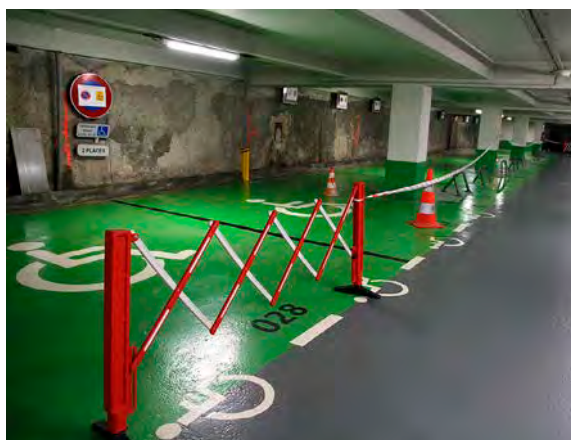
Les travaux se concentreront près des emplacements pour les personnes à mobilité réduite.

Tous travaux confondus, la municipalité avait prévu de consacrer une enveloppe de 90 000 € à ce parking cette année. Parallèlement, du fait des infiltrations, trente places demeurent inaccessibles au niveau -3. Soit une cinquantaine d'emplacements condamnés au total, sur les 285 que comptent les deux niveaux concernés.