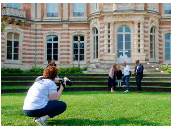
Le 29 août dernier, seuls ou en groupe, des habitants ont posé pour le Grand Est à Epernay, mais aussi à Reims.

La suite, c'est un clip vidéo baptisé « Mais quiiii ? ». Avec un contenu résolument dynamique, elle fait la promotion du Grand Est de manière originale. La vidéo présente les nombreux atouts du territoire dans des domaines aussi variés que l'économie, le tourisme, la culture, la gastronomie, les paysages, la mémoire, etc., sur un fond musical chanté, très rythmé et très décalé. À découvrir sur YouTube.