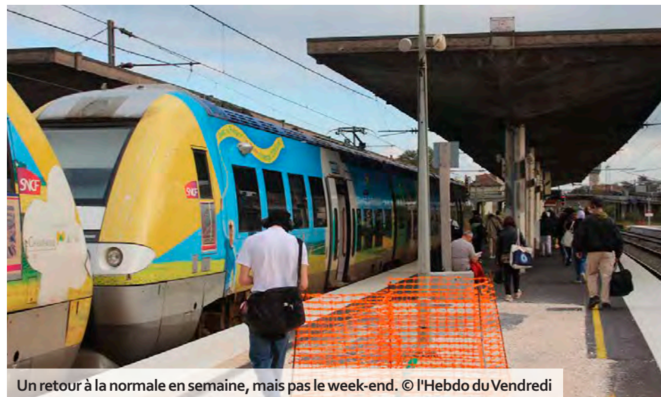
Un retour à la normale en semaine, mais pas le week-end.

Les équipes de SNCF Réseau, assistées par la société Guinotoli, spécialisée dans le terrassement en terrain difficile, indiquent « avoir travaillé sans re-