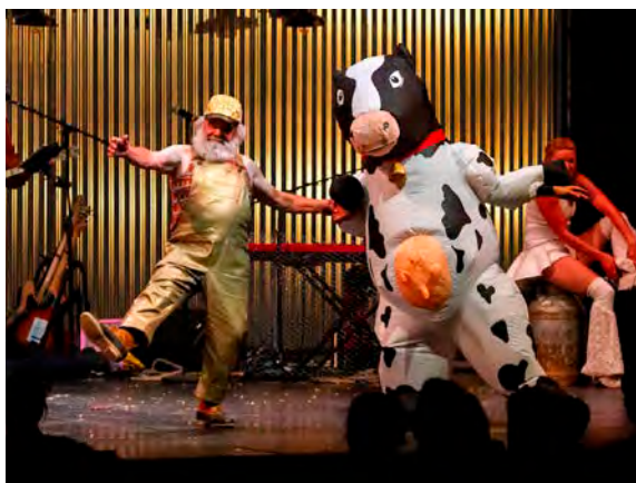
Musiciens et circassiens cohabitent avec de joyeuses créatures dans le spectacle « Animal ».

✓ Animal , jeudi 7 novembre à 20 h 30 (rencontre avec les artistes en bord de plateau à l'issue), vendredi 8 novembre à 19 h 30, la Comète, Châlons - Tarifs : de 7 à 26 € - Infos : la-comete.fr.