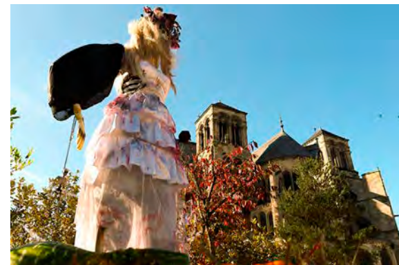
Monstres, squelettes et sorcières ont pris leurs quartiers dans Châlons.

Après un week-end rythmé aux couleurs de l'automne, Challoween débarque et propose, outre les scénographies et les monstres installés un peu partout en ville, un programme d'animations pour petits ou grands. Rendez-vous dès ce jeudi 31 octobre autour de deux événements dansants au choix : un grand bal de l'horreur sous la halle du marché couvert (de 18 h à 23 h) avec restauration et DJ, ou un bal costumé baptisé « Les fantômes du passé » dans la galerie de peintures du musée des Beaux-arts (à partir de 19 h). Déguisements obligatoires pour ce