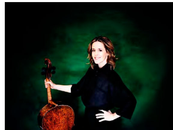
La violoncelliste Sol Gabetta est l'invitée de l'orchestre Les Siècles.

✓ Orchestre Les Siècles et Sol Gabetta , mercredi 5 novembre, à 20 h, Opéra de Reims. Tarifs : 5 à 49 €.