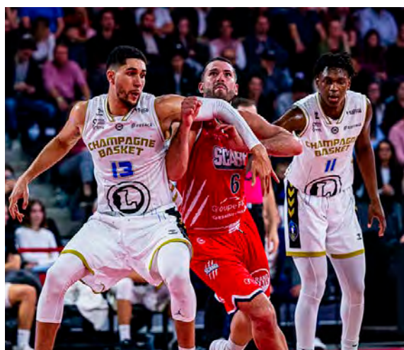
Entre le 29 octobre et le 5 novembre, trois matches sont au programme des Marnais.