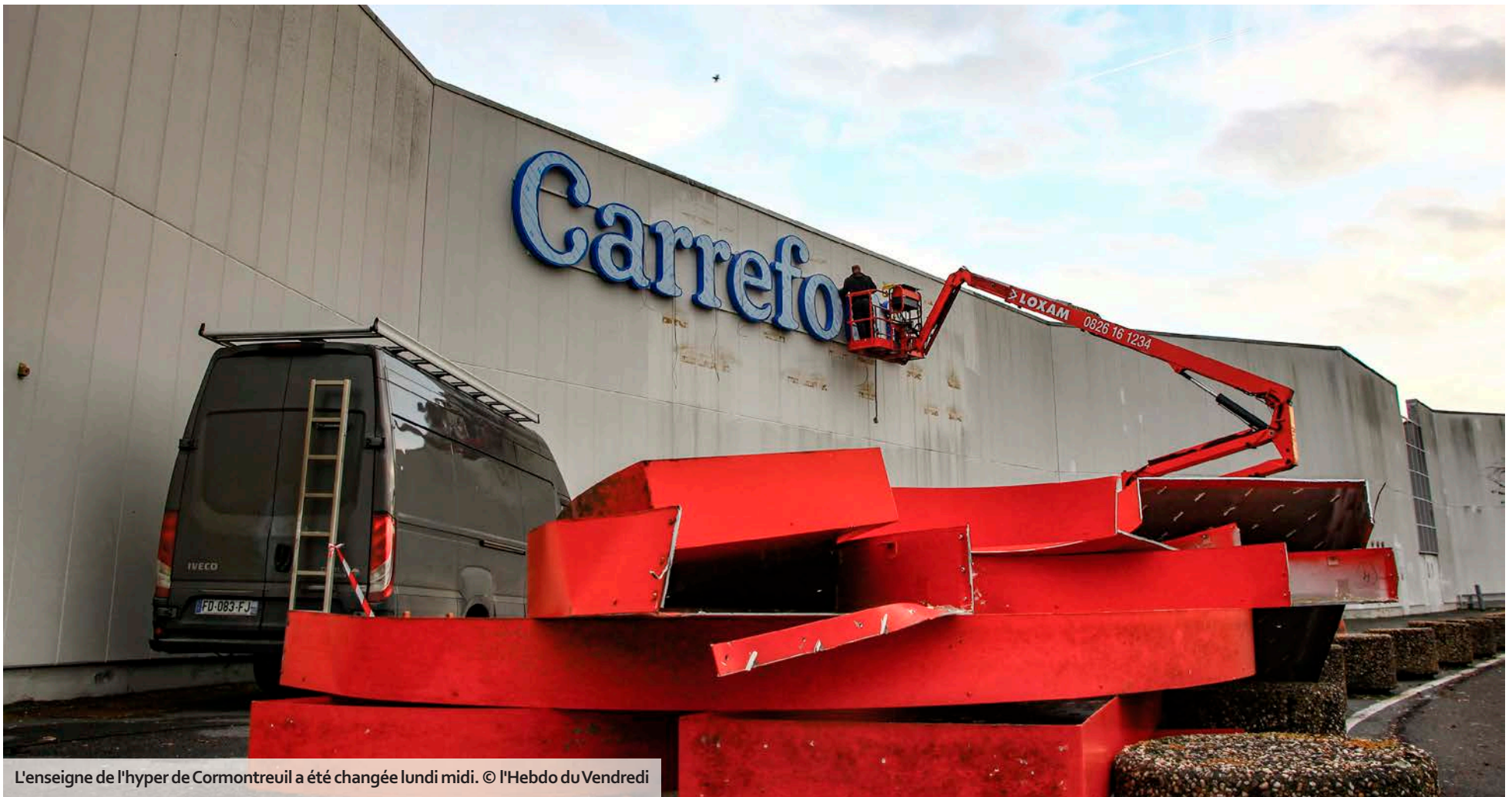
L'enseigne de l'hyper de Cormontreuil a été changée lundi midi.

Après le rachat des 60 magasins Cora par le groupe Carrefour l'été dernier, les hypermarchés se transforment progressivement. Lundi, l'établissement de Cormontreuil a changé sa façade. Celui de La Neuville, le second de la Marne, suivra ce mardi.