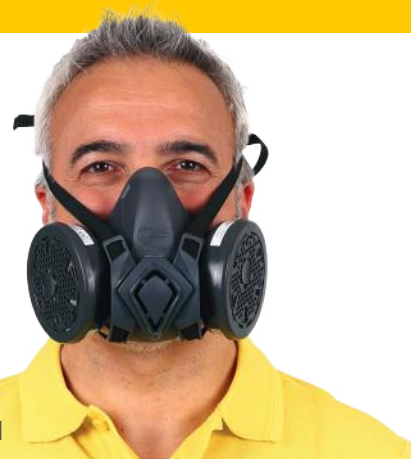
Art. nr. 8002111