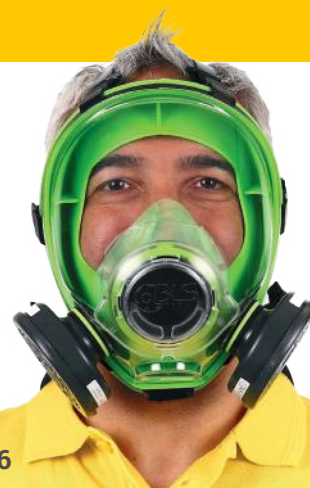
Art. nr. 8001036