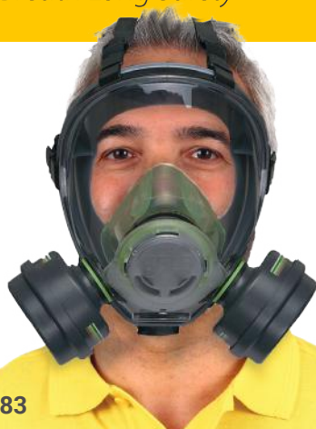
Art. nr. 8001083