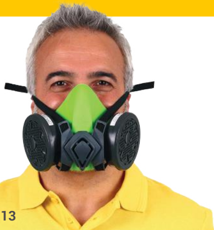
Art. nr. 8002113