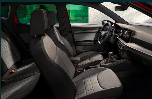
Sedili anteriori riscaldabili separatamente