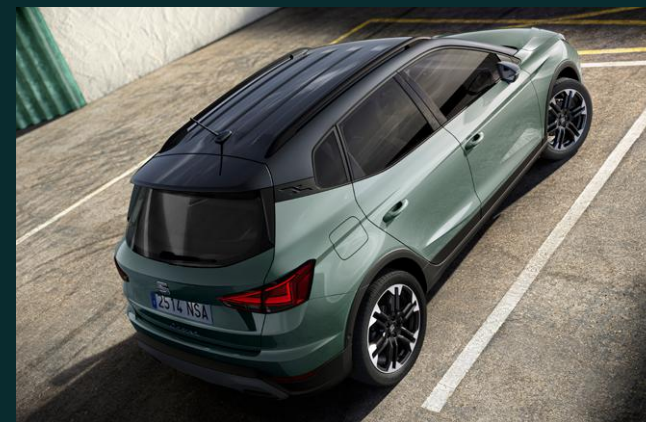
Maggiore personalizzazione: Tetto bicolore o verniciatura tinta unita