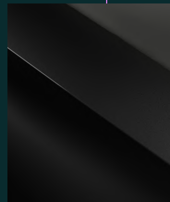
MIDNIGHT BLACK* metallic