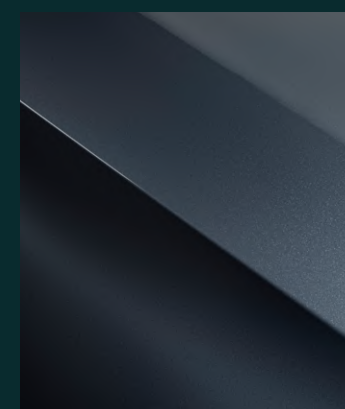
MAGNETIC GREY metallic