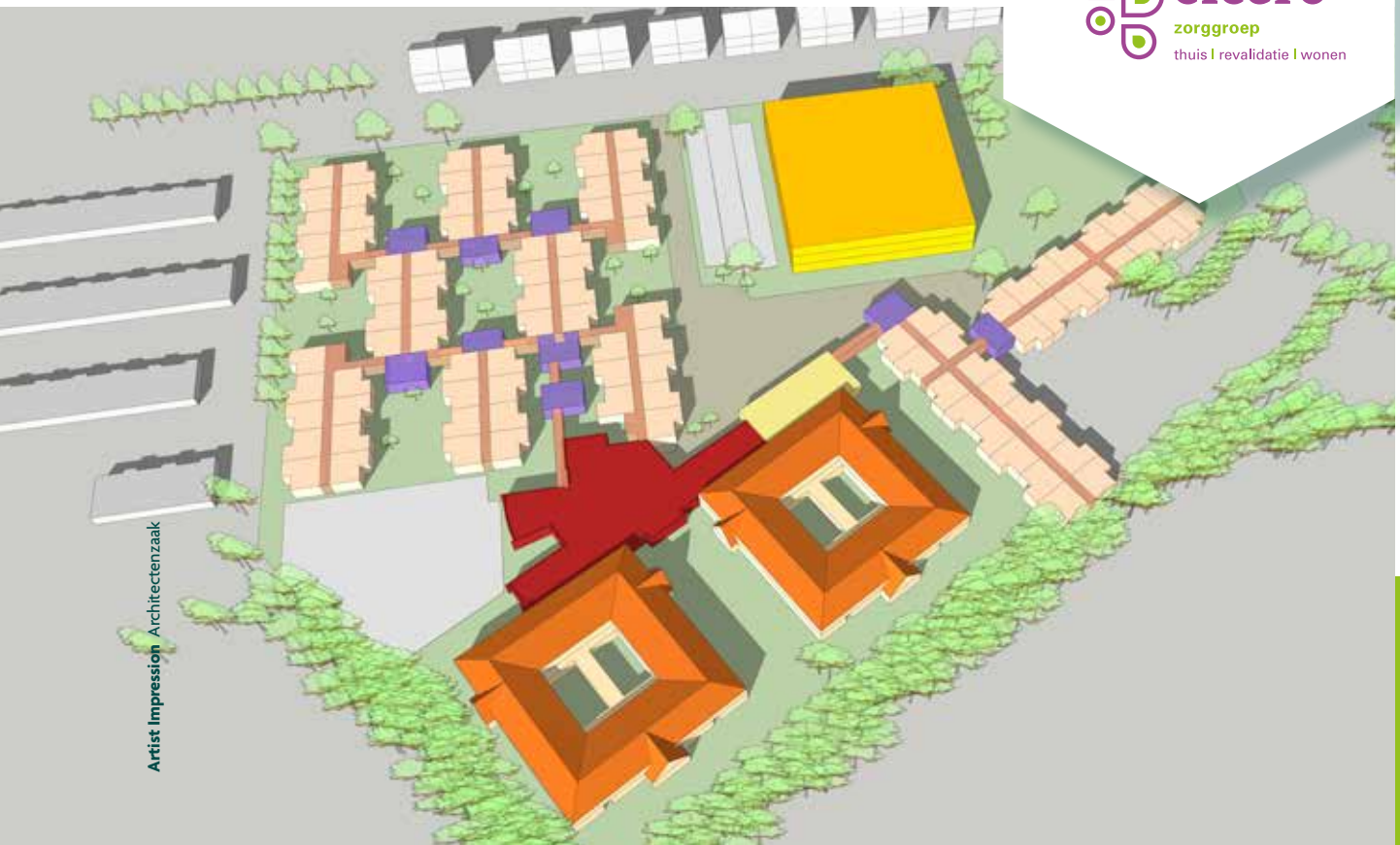
Artist Impression Architectenzaak

elkaar aansluiten. Een paneel waar een raam in zit, kan op eenvoudige wijze vervangen worden door een dicht paneel. “Dat gaat echt op een Jip-en-Janneke-manier”, vertelt Koster. “De panelen zijn niet zwaar, dus we kunnen dat prima zelf. Als het warm wordt, ben je blij dat je het felle zonlicht niet binnen krijgt.”