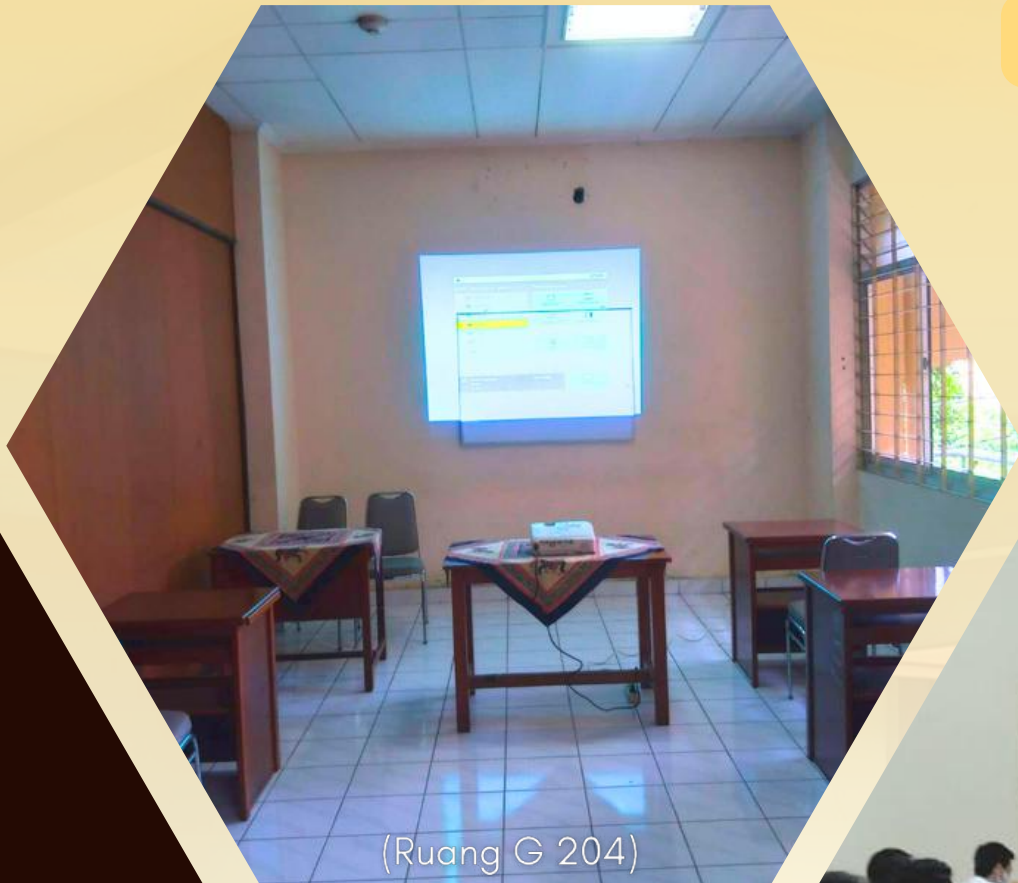
(Ruang G 204)