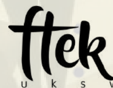
Fakultas Teknik Elektronika & Komputer