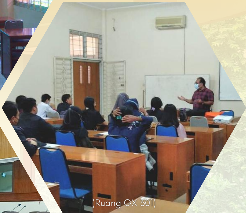
(Ruang GX 301)

Fasilitas: Tersedia 2 ruangan interview serta 1 kelas dengan kapasitas 12 orang dan LCD