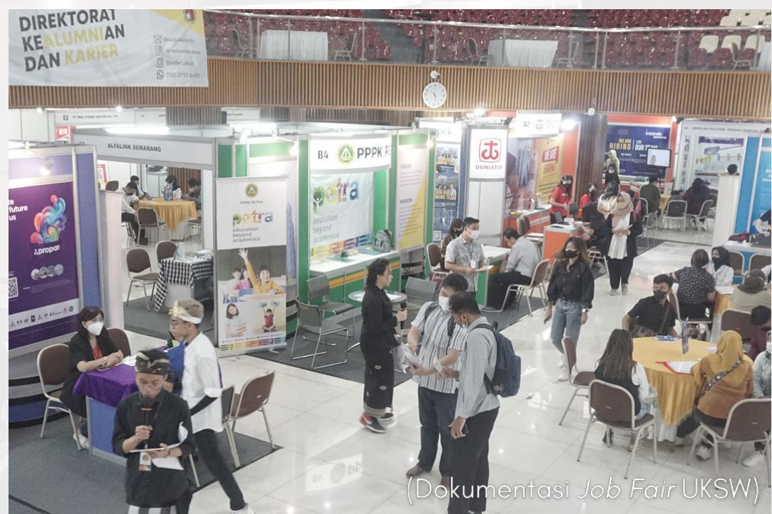
(Dokumentasi Job Fair UKSW)