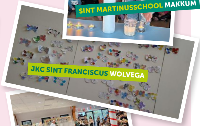
JKC SINT FRANCISCUS WOLVEGA