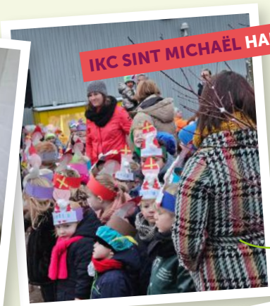
IKC SINT MICHAËL HARLINGEN

Peuter-kleuterplein Een knusse plek met ruimte om te spelen en ontdekken. Onze gezellige speel- en leerplek!