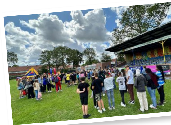
HET SLOTEVENEMENT BIJ IKC SINT THOMAS

zou het zijn wanneer we een aanbod realiseren voor alle kinderen van de gemeente Leeuwarden. Koepeloverstijgende ontmoetingen met alle groep 8-kinderen binnen de gemeente. Het kan!