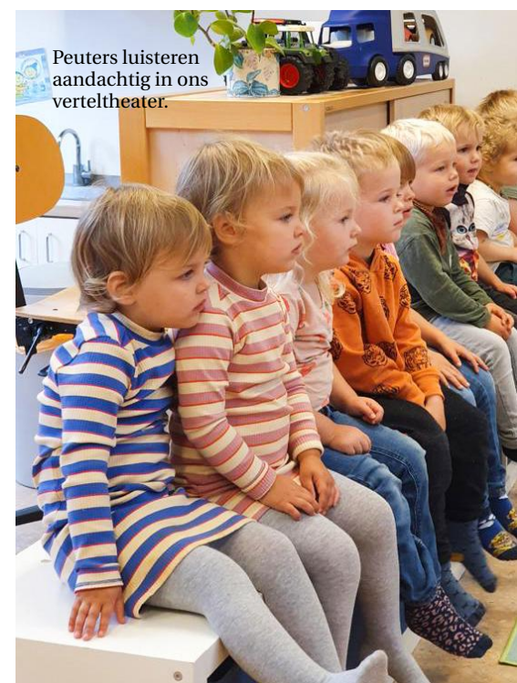
Peuters luisteren aandachtig in ons verteltheater.

de legomasters wiene eefkes by ús yn de kring, prachtig! Moai hoe hjir de meartaligens fan ús ûnderwiis sprekt. Mar ek hoe we alle dagen mei en fan elkoar leare kinne.