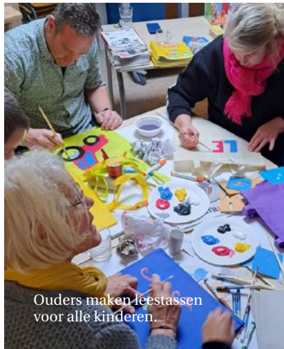
Ouders maken leestassen voor alle kinderen.

In samenwerking met de cultuurcoach van Kunstkade en de leesconsulente van dBieb hebben ouders leestassen gemaakt voor alle kinderen. In deze leestas kregen alle peuters en kleuters het boek