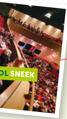
Naar het theater Groep 3, 4 en 5 zijn naar het sinterklaasprookje in het theater geweest.