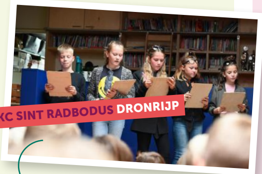
IKC SINT RABODUS DRONRIJP