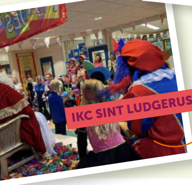
IKC SINT LUDGERUS BALK