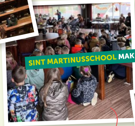
SINT MARTINUSSCHOOL MAKKUM

Wetenschap & Techniek Groep 4 heeft met glasverf led-lampen beschilderd en deze zelf in de kerstslinger gedraaid!