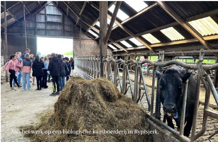
Aan het werk op een biologische kaasboerderij in Ryptsjerk.