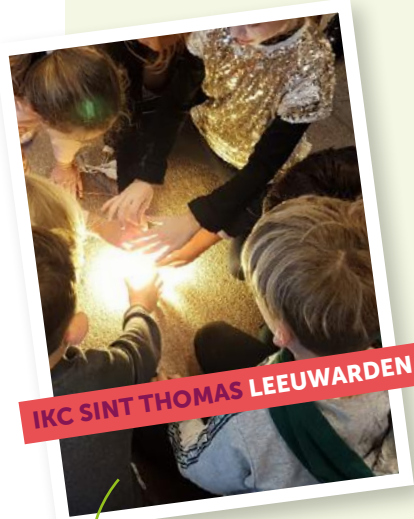
IKC SINT THOMAS LEEUWARDEN

Naar de kerk Gezamenlijke actie voor de voedselbank. Samen delen met Sint Maarten.