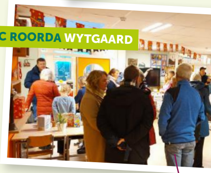
IKC ROORDA WYTGAARD