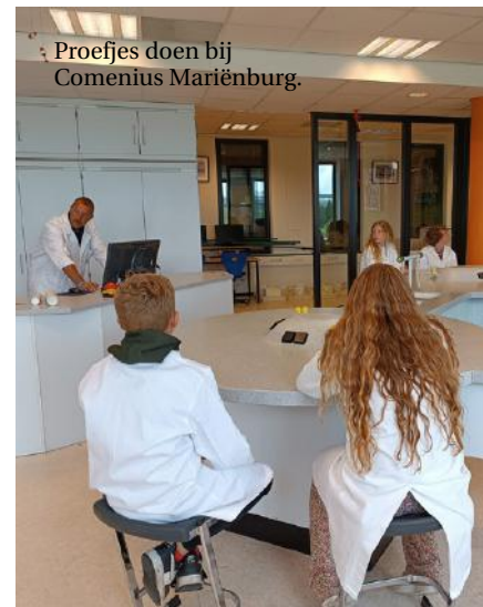
Proefjes doen bij Comenius Mariënborg.