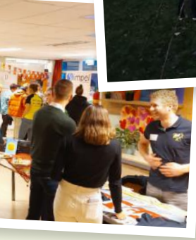
Ald treft nij Een bijeenkomst georganiseerd voor de nieuwe én oude inwoners van Wytgaard. Tijd om kennis te maken! Iedereen was welkom op ons IKC.