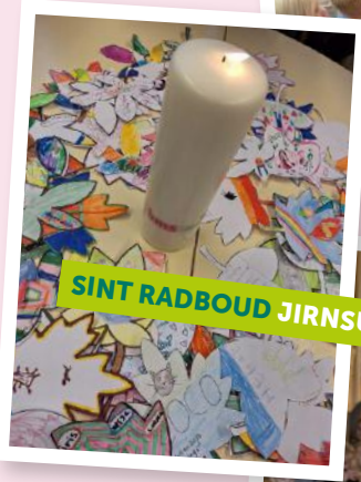
SINT RABOUD JIRNSUM