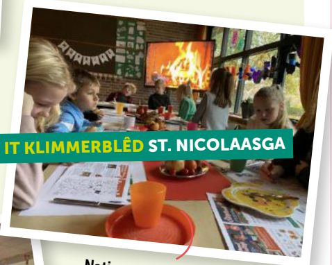
IT KLIMMERBLÈD ST. NICOLAASGA