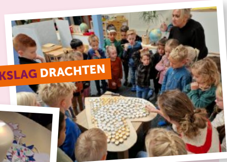
JKC DE WIEKSLAG DRACHTEN

Op donderdag 2 november was het Allerzielen, een dag waarop we denken aan de dierbaren die we moeten missen. Lang geleden of recent, we houden ze levend in onze herinnering.