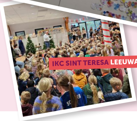
IKC SINT TERESA LEEUWARDEN