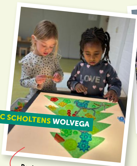
IKC SCHOLTENS WOLVEGA

Techlab De groepen 8 maken kennis met het Techlab van de middelbare school Simon Vestdijk.