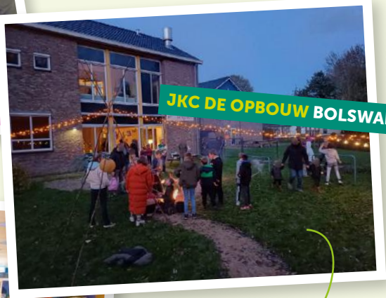
JKC DE OPBOUW BOLSWARD