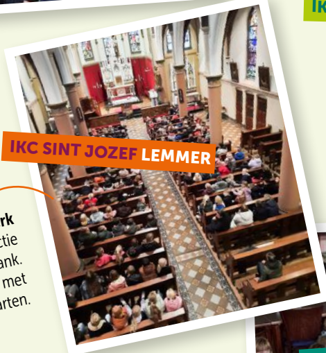
IKC SINT JOZEF LEMMER

Naar de kerk Gezamenlijke actie voor de voedselbank. Samen delen met Sint Maarten.