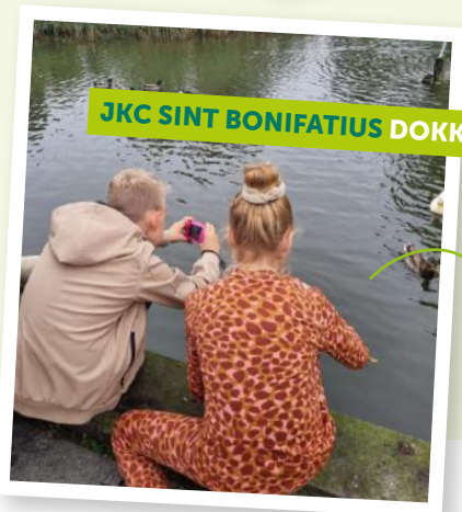
JKC SINT BONIFATIUS DOKKUM

Lichtjes en liedjes Kinderen met lampionnen en verhalen op bezoek bij Avondrust.