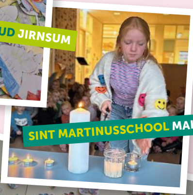
SINT MARTINUSSCHOOL MAKKUM