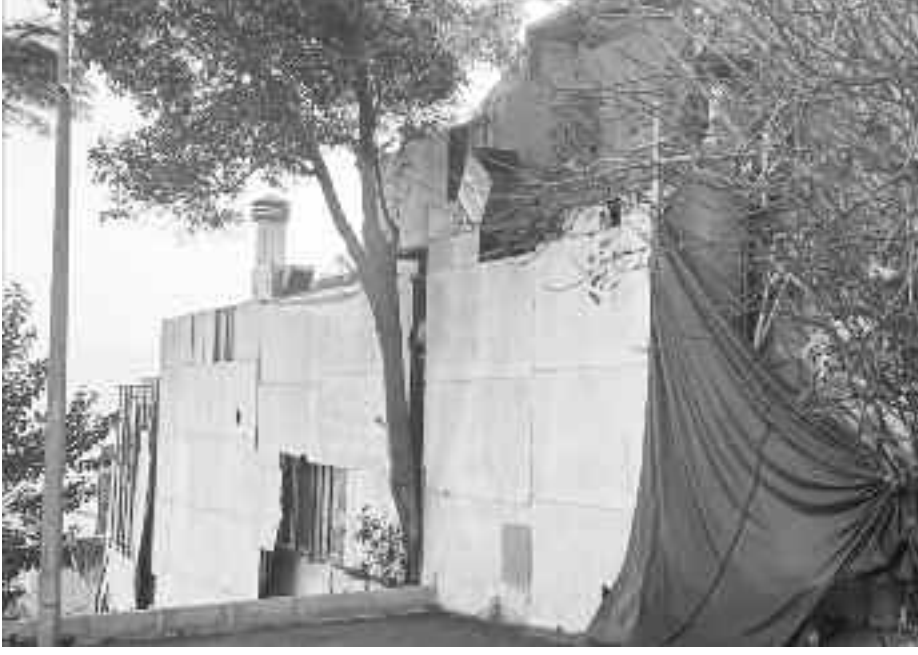
lenen baskınla yakaladı.