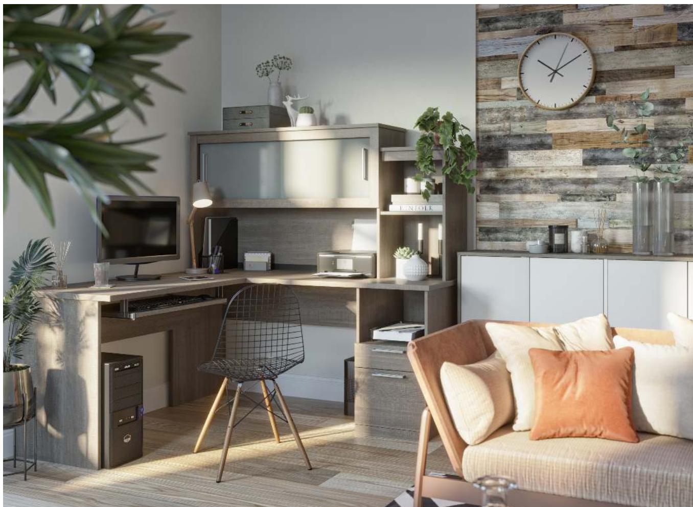
DAYTON SKU 88420