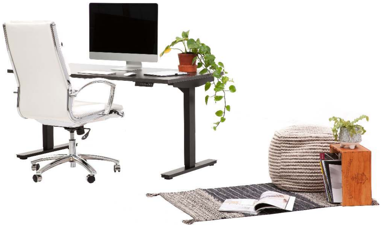
UNIVERSEL SKU 65867

Enfin, n'oubliez pas de bouger! Même avec le meilleur aménagement ergonomique, rester en position statique longtemps est exigeant pour le corps et les yeux. Accordez-vous des micropauses d'environ 30 secondes toutes les 30 minutes afin de faire circuler le sang et de réduire les inconforts. Pour diminuer les risques de fatigue visuelle, vous pouvez suivre la règle du 20-20-20 : regardez à une distance de 20 pieds pendant 20 secondes toutes les 20 minutes.