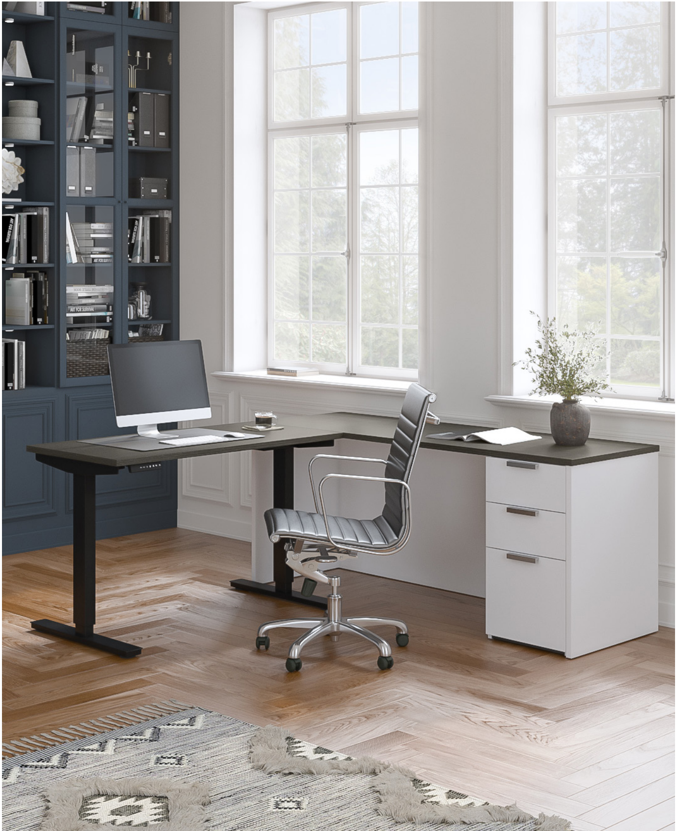
PRO-CONCEPT PLUS SKU 110895-17