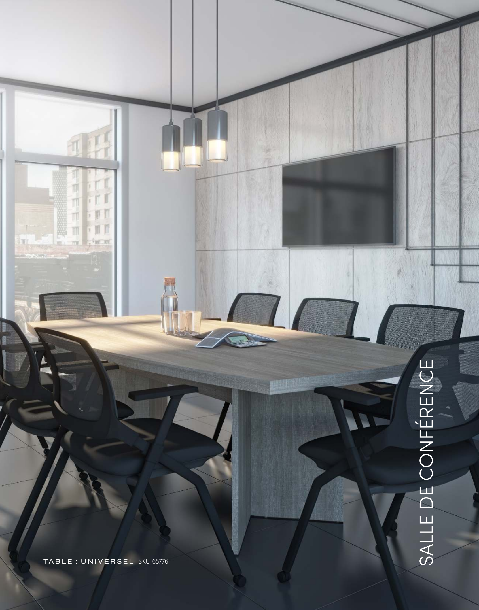
TABLE : UNIVERSEL SKU 65776