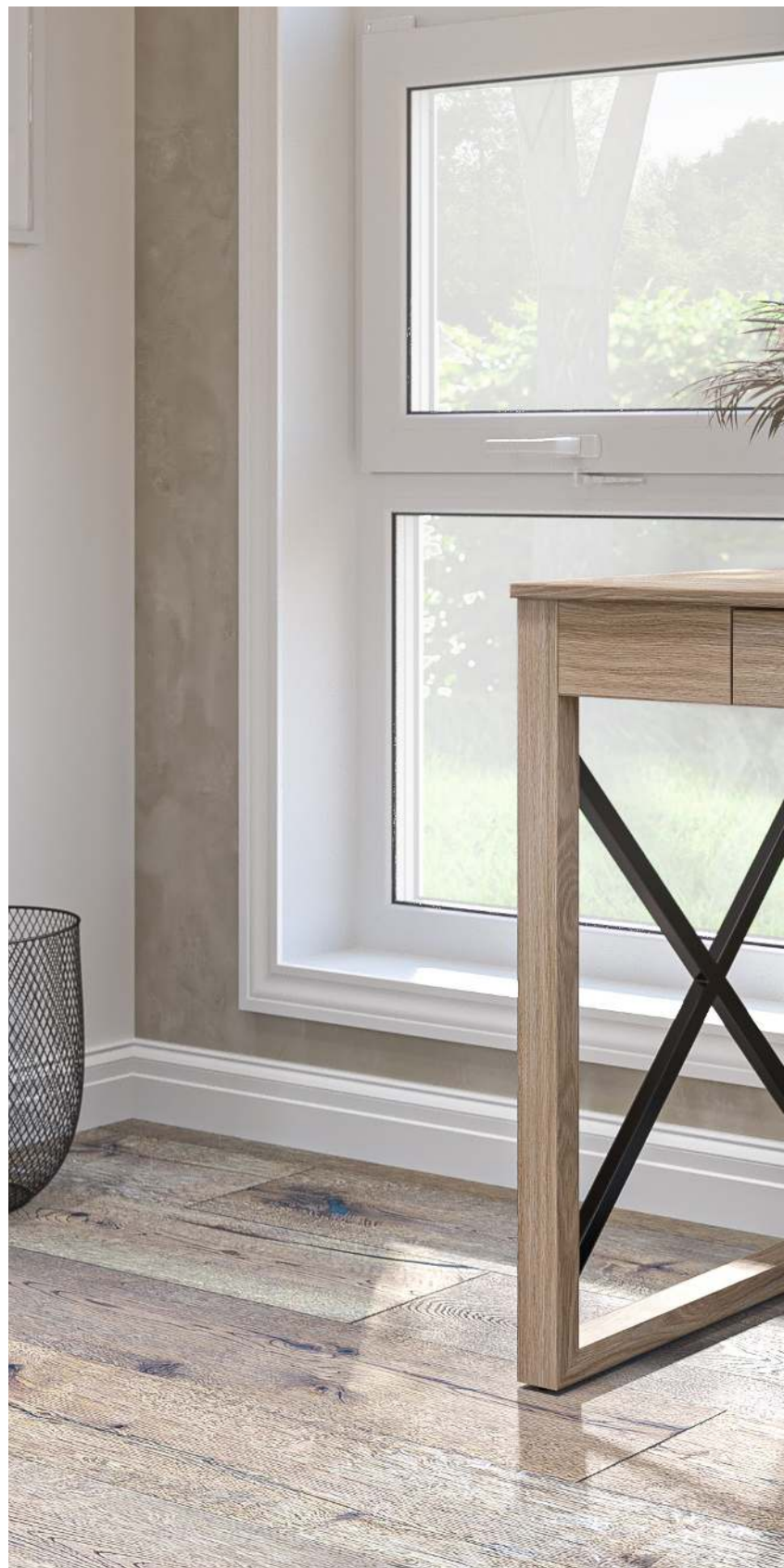
TALITA SKU 104400

Le petit bureau 45L de la collection Talita transformera même le plus petit espace grâce à son design «farmhouse» élégant. Procurez-vous ce meuble polyvalent pour créer un magnifique coin d'étude qui répondra à vos besoins.