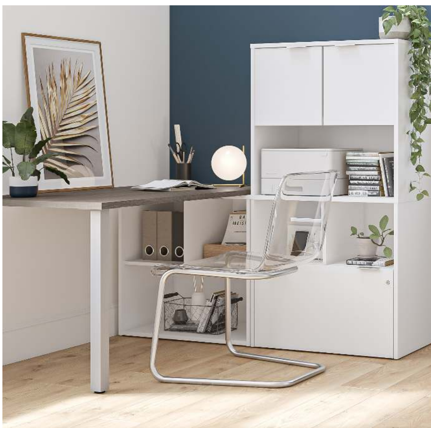
BUREAU : I3 PLUS SKU 160853

Vous devriez également essayer de rester en contact avec vos amis et amies quand vous le pouvez. Selon l'endroit où vous vivez, il peut être difficile de les voir en personne en ce moment. Cela dit, il existe plusieurs façons de communiquer en ligne, telles