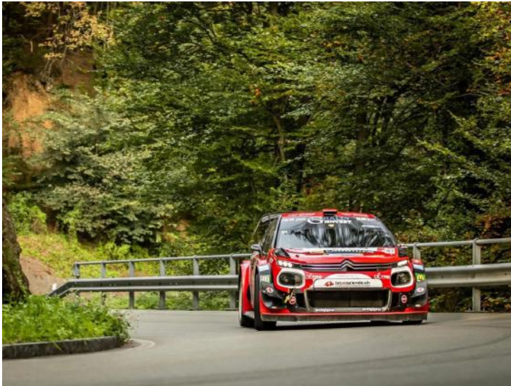
Kevin Gilardoni e Corrado Bonato al Rally del Ticino con la Citroën C3 WRC Plus di Gino Rally Invest

Una vittoria schiacciante, legittimata attraverso una progressione che ha visto il driver prevalere su tutte le prove speciali disputate