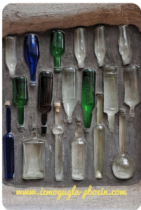
"KUNST HAUS" MUZEJ

Gradski prevoz je primer za mnoge gradove, tako da se na brzino stiže sa jednog na drugi kraj grada. Podzemna železnica (metro), tramavaj, autobus ili brzi voz, sve stoji na raspolaganju sa samo jednom kartom. Od pojedinačnih pa do dnevnih, šoping, nedeljnih ili mesečnih karata može se izbirati ono najpodobnije. Na vama je samo da izaberete najlepše i najinteresantnije za vas.