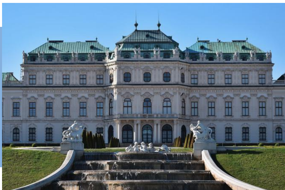
DVORAC PRINCA EUGENA – BELVEDERE