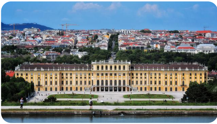
POGLED SA BRDA GLORIJETE NA DVORAC ŠENBRUN

Za sve one koji misle da je jednu metropolu lepše posmatrati sa visine, preporučujem kao vidikovce toranj na Dunavu, obližnje brdo „Kalemberg“ i Glorijetu, breg u sklopu dvorca „Schönbrunn“.