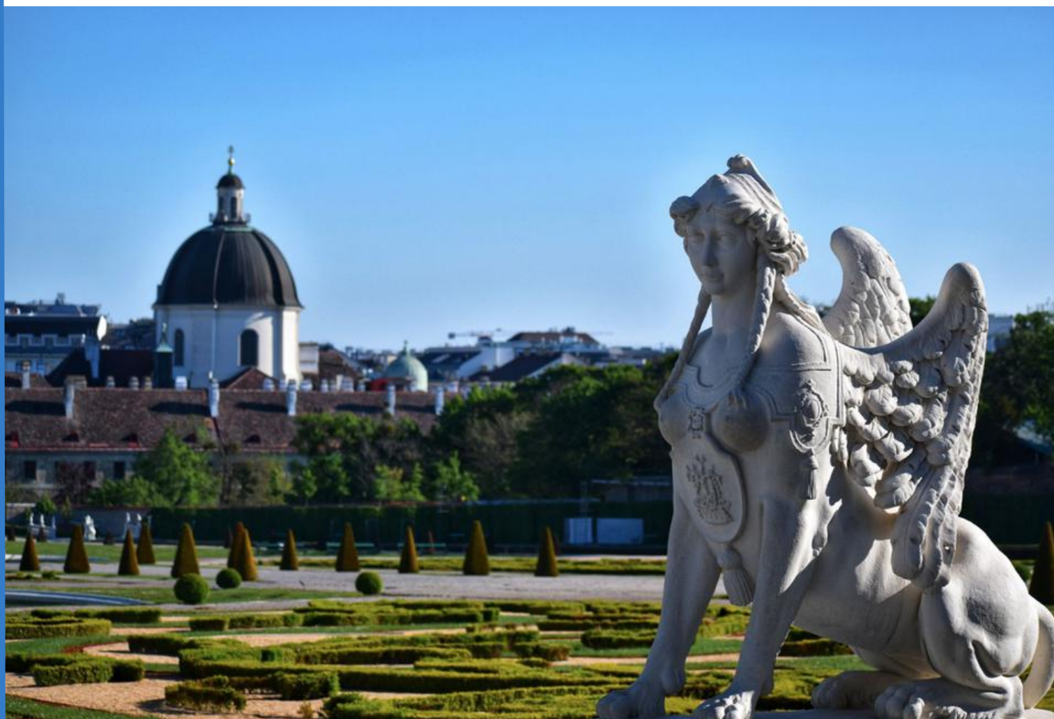
BAŠTA DVORCA BELVEDERE

Centralni deo grada, tzv. „Innere Stadt“ svrstan je u UNESCO-vu svetsku baštinu i oslikava evropsku istoriju kroz građevine iz srednjeg veka, specifičnog baroknog stila i neoklasicizma, i to je jedinstveni slučaj u svetu.