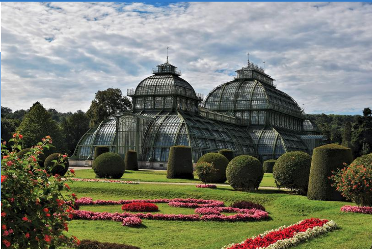
STAKLENA BAŠTA "PALMENHAUS"

Gradski prevoz je primer za mnoge gradove, tako da se na brzino stiže sa jednog na drugi kraj grada. Podzemna železnica (metro), tramavaj, autobus ili brzi voz, sve stoji na raspolaganju sa samo jednom kartom. Od pojedinačnih pa do dnevnih, šoping, nedeljnih ili mesečnih karata može se izbirati ono najpodobnije. Na vama je samo da izaberete najlepše i najinteresantnije za vas.