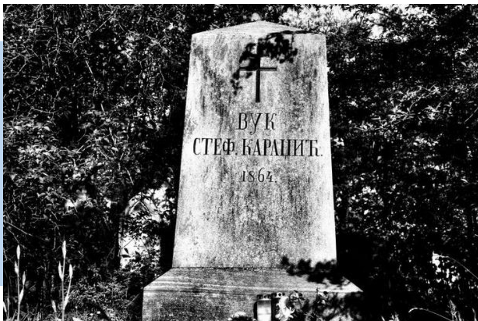
GROBLJE SV. MARKSA - GROBNO MESTO V.S. KARADŽIĆ

Kroz istoriju ostavio je ovaj grad značajne tragove i na Srbiju. Nekada negativne, a nekada pozitivne. Mnoge znamenite ličnosti su za vreme vladavine Turaka u Srbiji ovde živele i stvarale, gradovi Vojvodine dobijali su svoje nezavisne statuse slobodnog grada, a i prve škole dobijaju od Marije Terezije. U jedinom na svetu očuvanom groblju iz vremena Bidermajer, groblju Svetog Marksa, nalaze se i grobna mesta Vuka Stefanovića Karadžića i Jerneja Kopitara. O ovom mestu sam pisao u istoimenom članku, a da zagolica interesovanje tu je i misterija oko groba Volfganga Amadeusa Mocarta. Danas je ovo mesto više park sa klupama pod zaštitom države, nego groblje, a pošto preovlađuju jorgovani, lepo ga je posetiti na proleće, u vreme njihovog cvetanja.