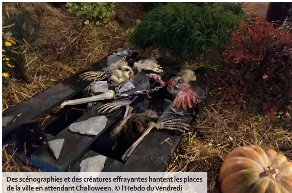
Des scénographies et des créatures effrayantes hantent les places de la ville en attendant Challoween.

L'opération « Châlons d'automne » fait son entrée dans l'agenda de la ville. Elle réunit une pléiade d'animations de saison pour petits et grands, à déguster sans modération. Dès 19 h ce vendredi 25 octobre, une « soupe d'automne » solidaire concoctée par le Chaudron savoyard et le Secours catholique s'installera place Foch, suivie d'une distribution de pop-corn et d'une projection ciné en plein air. Plaids chaudement recommandés ! Au programme, samedi 26 octobre : brade-livres à la médiathèque Pompidou, sculptures de légumes, ateliers créatifs et initiations au graffiti rue des Fripiers, confection de citrouilles d'Halloween et découvertes horticoles au centre socioculturel du Verbeau. La soirée se poursuivra rue Gambetta et sous la halle du marché couvert, avec des dégustations de produits du terroir et le concert jazz du duo Velvet Anacrouse.