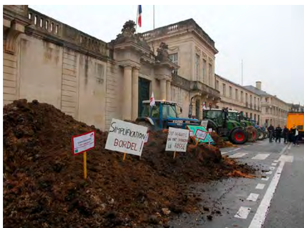
L'annonce du soutien du Grand Est intervient quelques jours après la manifestation des agriculteurs.

D'abord, un accompagnement de 6,9 M€ consacré à 1 380 agriculteurs, principalement les jeunes éleveurs installés en région depuis 2020 pour les aider dans la recapitalisation de leurs cheptels. Ils pourraient recevoir un coup de pouce de 5 000 € par exploitation d'ici la fin de l'année. Ensuite, un soutien spécifique de 100 000 € aux éleveurs touchés par la fièvre catarrhale ovine, notamment pour déployer des tests de fertilité sur les animaux reproducteurs. Enfin, le Grand Est s'engage à mobiliser un fonds de garantie bancaire de 2,5 M€ auprès des agriculteurs pour faciliter l'obtention de prêts. Il proposera des garanties allant de 2 à 15 ans, selon la nature des emprunts, et pourra être activé dans différents cas de figure : besoins en fonds de roulement, reprise ou création, développement de l'exploitation.