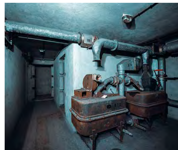
L'ancien bunker de la gare, un lieu atypique chargé d'histoire(s).