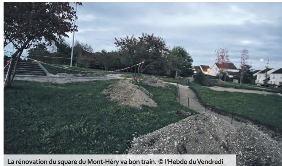
La rénovation du square du Mont-Héry va bon train.

nancé à hauteur de 60 000 € par la ville et l'agglomération.