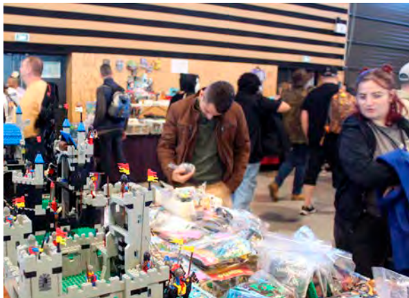
À Tours-sur-Marne, vendeurs particuliers et collectionneurs de jouets sont réunis durant deux jours.

Dans un calendrier plutôt fourni, la bourse aux jouets proposée ce week-end à Tours-sur-Marne se démarque des habituels « vide-poussettes » et autres « broc'enfants ». D'abord, l'événement organisé par l'association Familles rurales du village ne se tient non pas sur une matinée ou une journée, mais sur deux jours, donnant ainsi au plus grand nombre la possibilité de venir faire de bonnes affaires. Surtout, en plus d'accueillir de nombreux particuliers qui viendront y vendre les jouets, livres et jeux vidéo dormant dans leurs placards, plusieurs collectionneurs seront également présents, chacun ayant leur spécialité : Lego, Playmobil, figurines Manga et Pokémon. Tous proposeront à la vente des produits d'occasion en très bon état, mais aussi des modèles de collection, anciens et récents. À deux mois de Noël, l'offre promet donc d'être particulièrement intéressante, d'autant qu'un autre stand original vendra des décorations, elles aussi d'occasion, ayant servi à donner des airs de fêtes à de grands magasins. Au total, plus de 5 000 boules seront à saisir à petits prix, de la traditionnelle petite sphère qu'on accroche au sapin à la boule géante pailletée de 60 centimètres de diamètre !