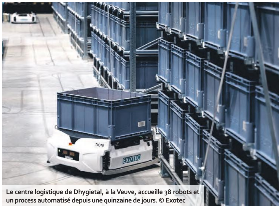
Le centre logistique de Dhygietal, à la Veuve, accueille 38 robots et un process automatisé depuis une quinzaine de jours.