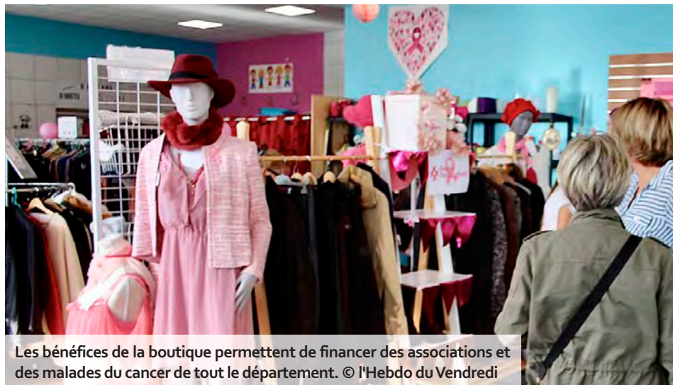
Les bénéfices de la boutique permettent de financer des associations et des malades du cancer de tout le département.