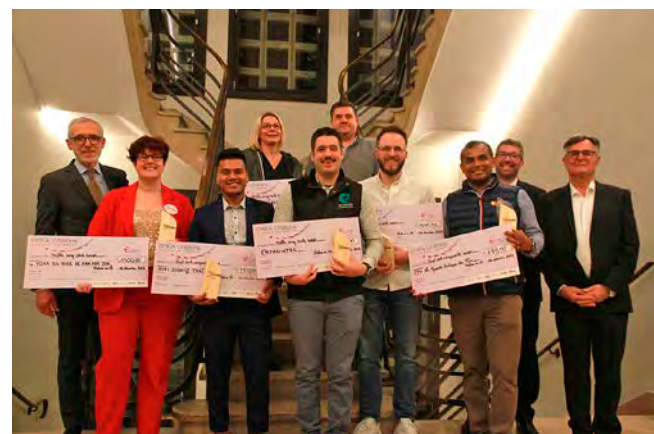
Les Trophées du Mess ont distingué 6 lauréats parmi 22 candidats l'an passé.

À condition que leur entreprise existe depuis moins de cinq ans, les volontaires ont jusqu'au vendredi 22 novembre prochain pour proposer leurs candidatures et tenter de remporter l'un des prix - de 1 500 € chacun - attribués aux cinq catégories suivantes : artisanat et industrie, commerce, services, entreprises en cours de création et entrepreneuriat au féminin. L'édition 2023 a fédéré 22 candidats, contre plus d'une trentaine avant 2020. Le record de participation sera-t-il de nouveau atteint cette année ? Réponse début décembre, lors de la traditionnelle remise des trophées à Châlons, au Mess des entrepreneurs.