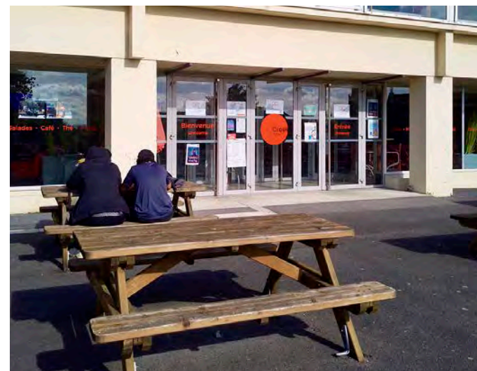
Le restaurant universitaire du Moulin de la Housse était fermé mardi.

Le préavis a finalement été levé à 17 h. Une réunion incluant les représentants du personnel et la direction du Crous de Reims s'est tenue dans l'après-midi « afin d'évaluer les revendications et éléments de discussions à mettre en place à court et moyen terme », explique cette dernière. Une discussion et un dialogue très pragmatique se sont tenus avec des revendications sur des demandes de recrutements dans les services de restauration du Crous de Reims principalement. »