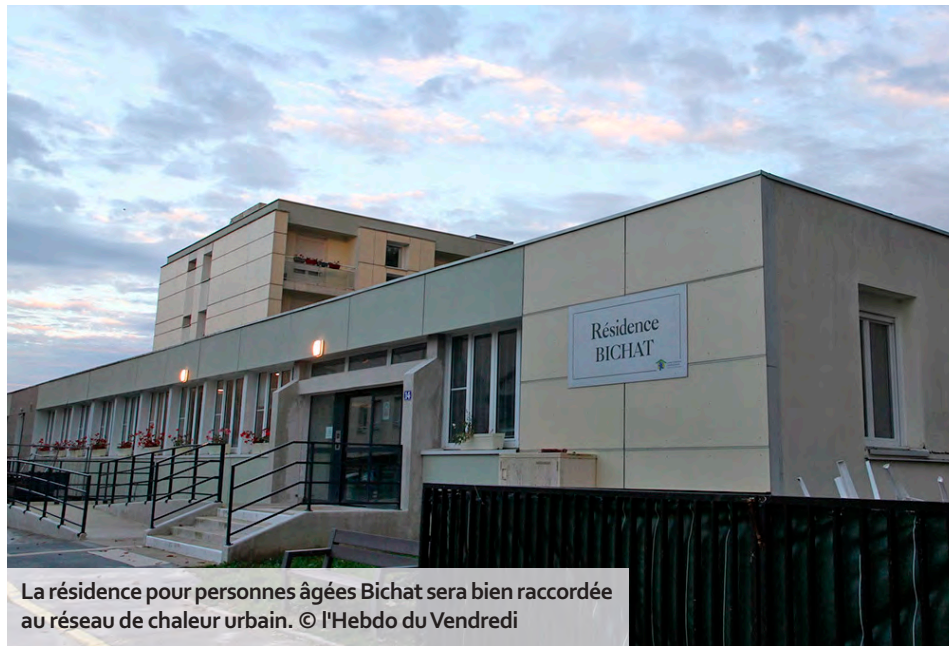
La résidence pour personnes âgées Bichat sera bien raccordée au réseau de chaleur urbain.