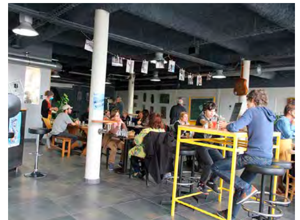
La Cantine du 111 reprendra bientôt du service, à Châlons.

Chaque mois, les expositions d'artistes variés s'installent sur place. Chaque semaine, l'équipe concocte des menus thématiques pour faire voyager les gourmands. Prochaines escales : le Cameroun, la Réunion, le Zimbabwe, l'Alsace ou encore la montagne. Réservations chaudement recommandées pour lutter contre le gaspillage !