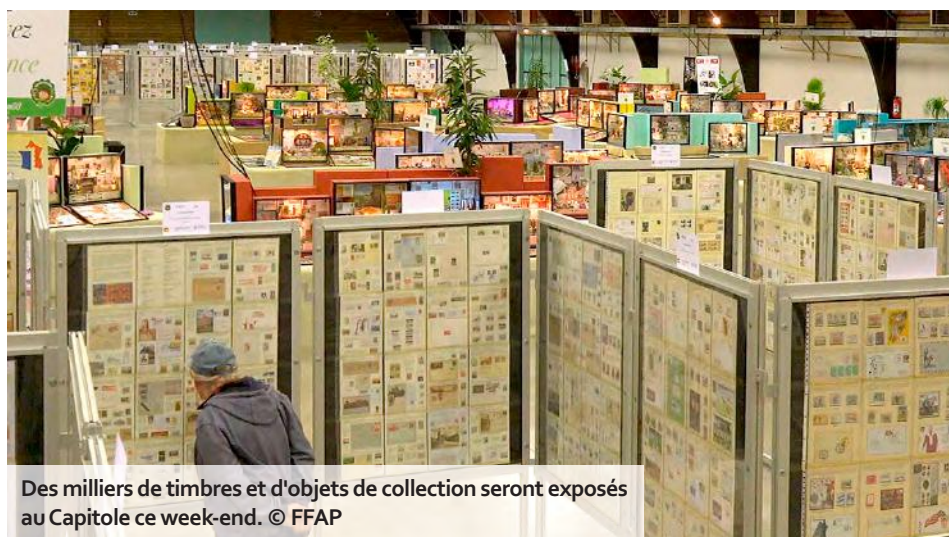
Des milliers de timbres et d'objets de collection seront exposés au Capitole ce week-end.