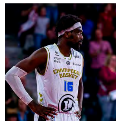
Cette saison, Châlons-Reims possède seulement le 10e budget et la 12e masse salariale de la Pro B.

Plus significatives encore sont les données concernant les masses salariales, c'est-à-dire l'argent consacré aux salaires des joueurs professionnels. Alors que la moyenne en Pro B est de 0,910 M€, en hausse de 10 %, celle du Champagne Basket est de 0,857 M€, contre 0,959 M€ l'an dernier (-11 %). Ainsi, en 2023/24, c'était la 5e plus importante de la division. Cette saison, ce n'est plus que la 12e. Dans ce domaine, les trois clubs les plus riches sont Roanne (1,374 M€), Orléans (1,243 M€) et Caen (1,112 M€).