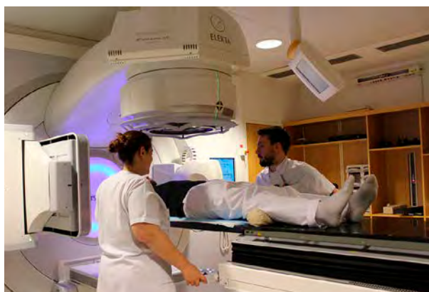
Ce projet à 30 M€ doit permettre d'augmenter la capacité d'accueil de l'établissement.

Celui-ci prévoit également le développement d'un nouveau plateau ambulatoire et la rénovation de la pharmacie, tandis que les extensions de la médecine nucléaire et de la radiothérapie ont déjà été réalisées. Enfin, la seconde phase, en cours de réflexion, concernera plus particulièrement les secteurs d'hospitalisation, les plateaux techniques, la création d'un espace prévention, la recherche, la formation et les infrastructures techniques. Cette modernisation intègre le concept d'« hospitality », qui s'inspire des codes hôteliers pour générer davantage d'apaisement pour les patients et de bien-être pour les professionnels. L'institut Godinot, qui compte plus de 600 professionnels et traite 27 000 patients par an, vise à accroître ses capacités d'accueil et à intégrer de nouvelles activités.