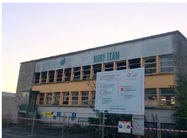
L'ancien site de MoryTeam, à l'abandon depuis mars 2015, avenue Ampère.

A l'abandon depuis sa liquidation judiciaire en mars 2015, l'entreprise de transport et de logistique MoryTeam, implantée avenue Ampère, disparaîtra définitivement du paysage châlonnais d'ici décembre. Cette friche de plus de 11 000 m 2 composée d'entrepôts et de bureaux a été rachetée par Châlons Agglo en 2020 au prix de 126 500 €. Mais les intrusions, les dégradations volontaires et les incendies se sont multipliés sur place ces dernières années, laissant le site dans un état déplorable.